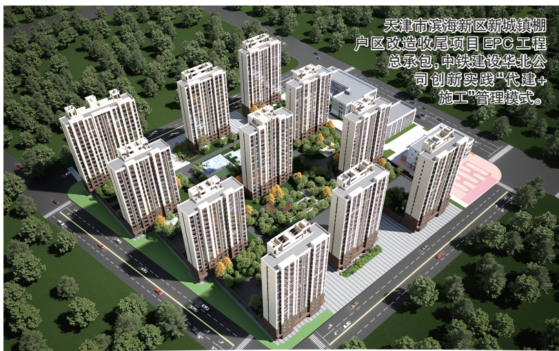
天津市滨海新区新城棚湖区改造收尾项目EPC工程总承包，中铁建设华北公司创新实践“代建+施工”管理模式。