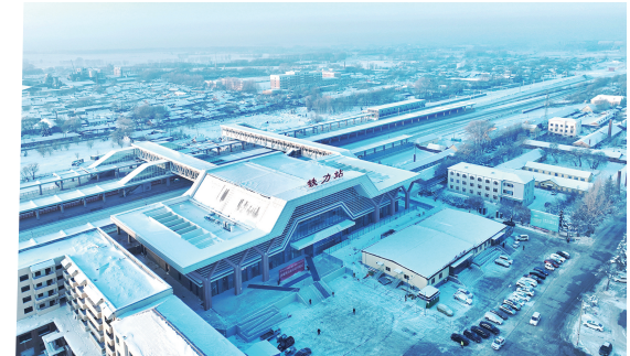
中铁建设华北公司承建的我国首个在高寒地区大规模运用“装配式混凝土雨棚”施工工艺的高铁站场力站。