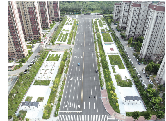
中铁建设华北公司承建的宝坻城区智慧停车项目一期工程市政道路工程项目，是当地推进提升道路交通出行品质“十项攻坚”重点项目之一。