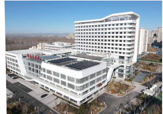
固安中医院建设项目，中铁建设华北公司助力打造集高效智能、人性自然、绿色可持续发展于一体的现代化中医院。