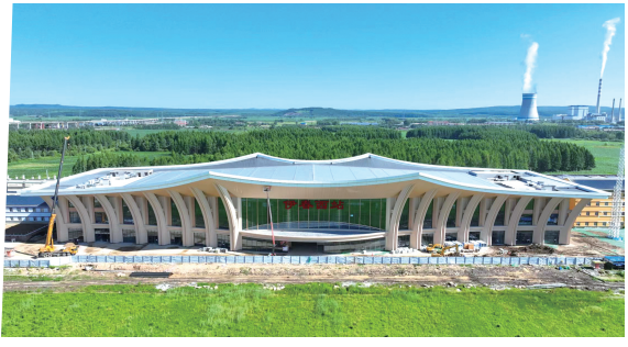
中铁建设华北公司承建的我国最北高铁站房伊春西站