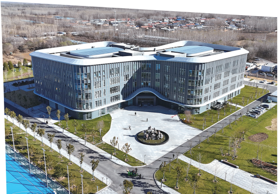
北华航天工业学院暨空天技术应用实训基地建设项目，中铁建设华北公司助力学校布局航空航天、高端装备制造等学科产业。

站在“十四五”与“十五五”交汇的历史节点，中铁建设华北公司将继续以精工善建为舟，以初心使命为帆，在服务构建新发展格局、推动高质量发展的时代大潮中，奋楫扬帆，破浪前行，谱写属于新时代奋斗者的崭新篇章！