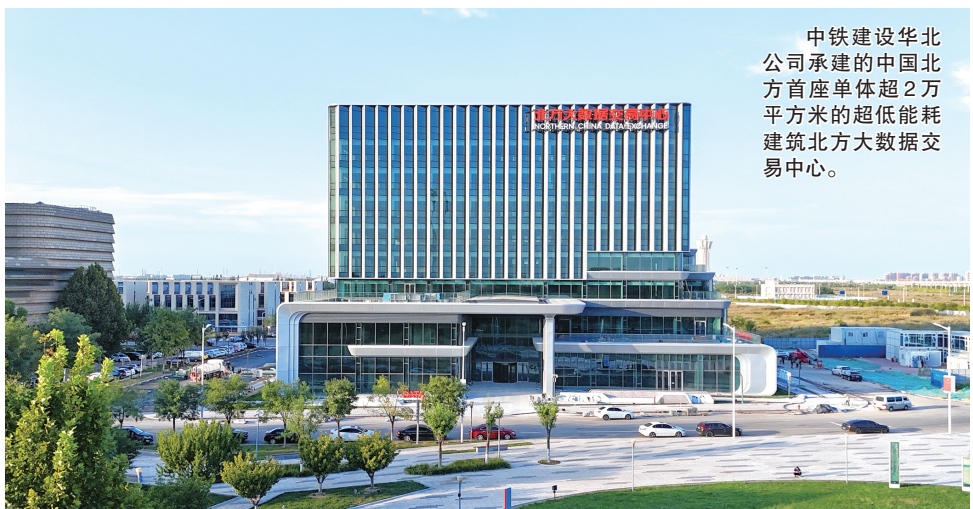
中铁建设华北公司承建的中国北方首座单体超2万平方米的超低能耗建筑北方大数据交易中心。