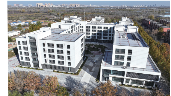
中铁建设华北公司承建的河北经贸大学数字经济研究中心建设项目。