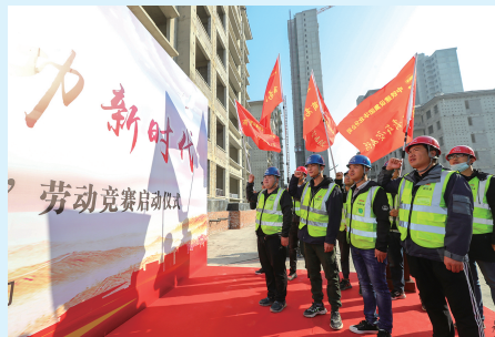
中铁建设华北公司组建党员先锋队，在项目建设中扛重担、作表率，凝聚团队力量，确保使命必达。

过月度经济分析会进行“动态体检”，成本是否超支、进度是否偏差、资源是否错配，都能及时暴露和纠偏，确保了项目全过程的健康受控。”不止于此，技术创新与精益管理的融合在实践中也不断深化。在北方大数据交易中心项目，团队深度融合BIM、物联网、VR智能眼镜与自主研发的156智慧建造平台，探索智能建造与数字化管理新路径。在天津新城镇棚户区改造项目中，公司成功实践“代建+施工”的创新管理模式，不仅负责施工建设，更前期深度介入项目规划与设计优化，并向后延伸运维服务建议，实现了从单一“工程承包商”向“城市综合服务商”的角色演进探索。