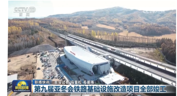
中铁建设华北公司承建的第九届亚冬会亚布力赛区重要交通设施亚布力西站获央视总台报道。