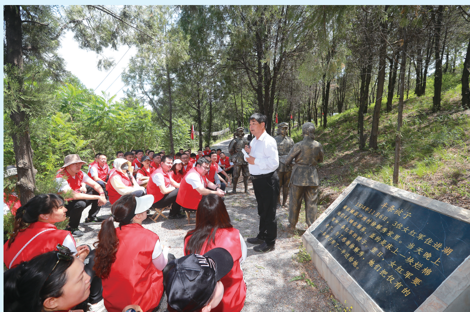
中铁建设华北公司党员干部将党课课堂搬进红色基地，在革命旧址、纪念馆中，借助“小马扎”形式开展沉浸式学习。

当梳理“十四五”的成就时，就会发现中铁建设华北公司的身影，已深深嵌入京津冀协同发展、东北全面振兴、共建“一带一路”倡议等一幅幅波澜壮阔的国家蓝图之中。这五年，是中铁建设华北公司以专业建造服务国家战略、以实干担当回应时代命题的五年，也是其在高质量发展道路上不断锤炼核心竞争力、坚定履行央企使命的五年。