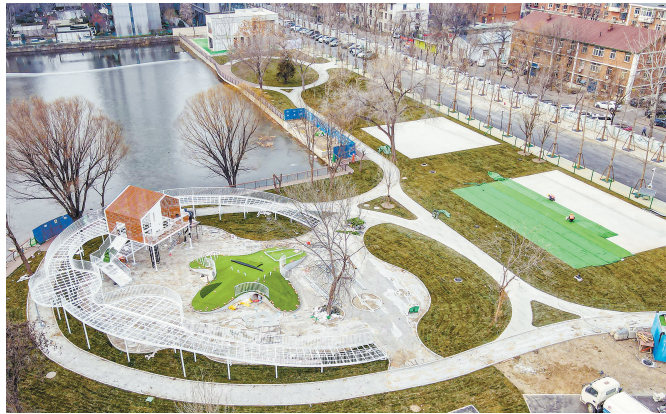
位于河西区体院道与环湖中路交汇处的体西体育公园建设主体基本完工,有望明年上半年对外开放。

今年10月下旬以来,天津市公安局交通管理局已对全市50余处点位的交通信号灯相位、信号配时开展了精细化调整。例如,河北区王串场一号路与正义道交口,延迟对向绿灯12秒,有效分离车流;河西区解放南路与珠江道交口,分时段差异化调整信号配时,平衡各方向通行需求。这些措施均以调研数据为基础,以市民实际感受为导向,旨在最大限度挖掘现有道路资源的通行潜力。