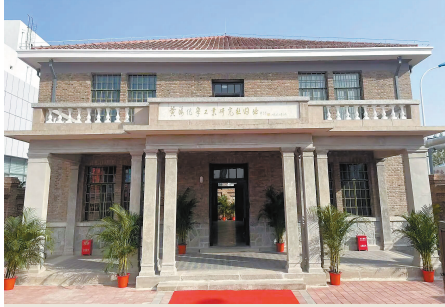
黄海化学工业研究社旧址。