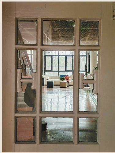
天津市总工会第二工人疗养院旧址内部。记者 曹彤 摄

近年来,天津深入挖掘历史文化底蕴,着力推进盘活历史文化资源。近期,市文博学会组织遴选,确定了原开滦矿务局大楼、法国公议局旧址、吉鸿昌旧居、奥匈帝国俱乐部旧址、天津市总工会第二工人疗养院旧址、黄海化学工业研究社旧址为2025年历史文化资源盘活推介案例,通过“保护+活化”创新模式,让历史建筑重焕光彩。