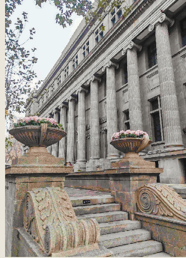
原开滦矿务局大楼。记者 曹彤 摄