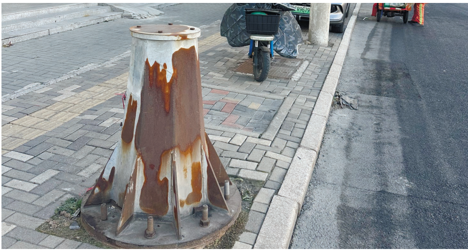
华昌道上的废弃底座。

针对这一长达近十年的城市管理“死角”，记者分别联系了多个部门，但目前并没有找到管理方。河东区政府称，路灯并不在河东区的管辖范围内；天津市路灯管理处说这不是他们的产权；交管部门查看后表示，该底座不是信号灯底座，也不属于交管部门管理；天津市城市管理委员会经