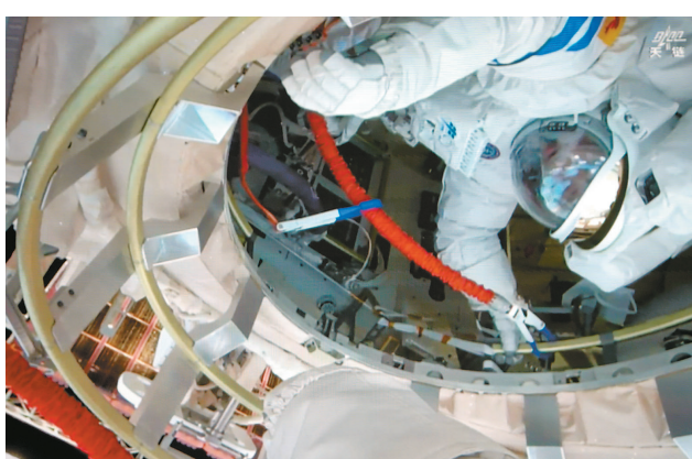
▲ 12月9日在北京航天飞行控制中心屏幕上拍摄的神舟二十一号乘组航天员张陆(左)与武飞在舱外工作的画面。 ▲ 武飞(上)向张陆传递设备。