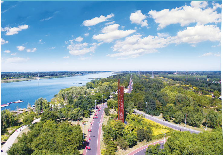
潮白河国家湿地公园