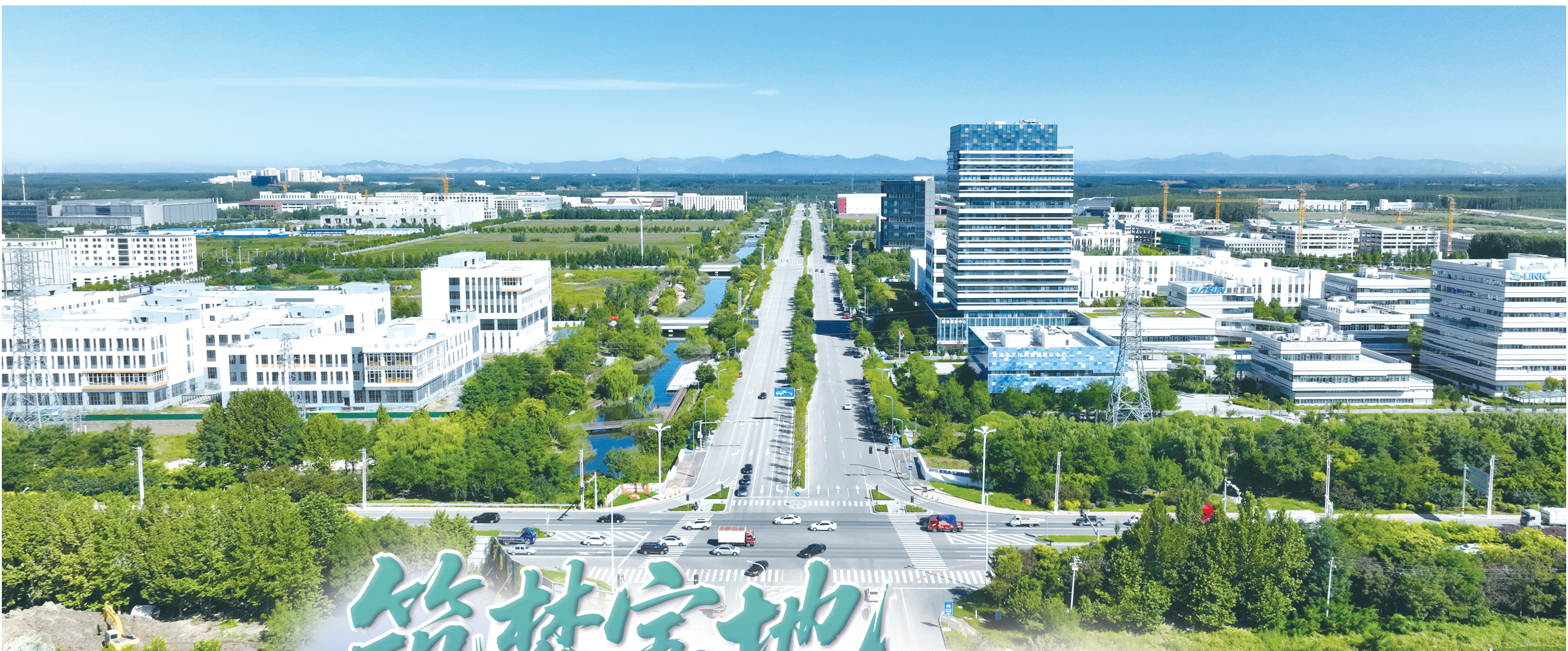
京津中关村科技城