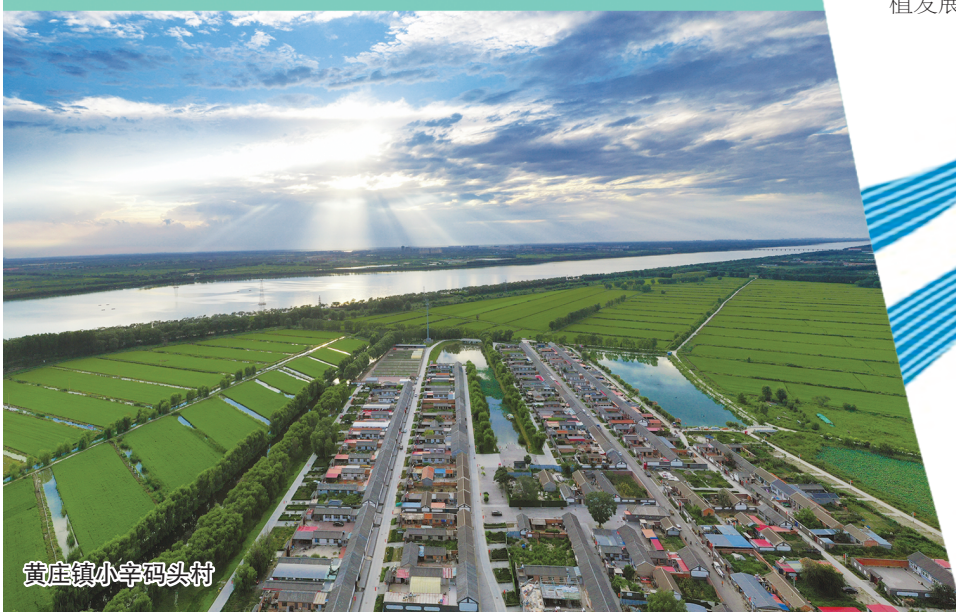
黄庄镇小辛码头村