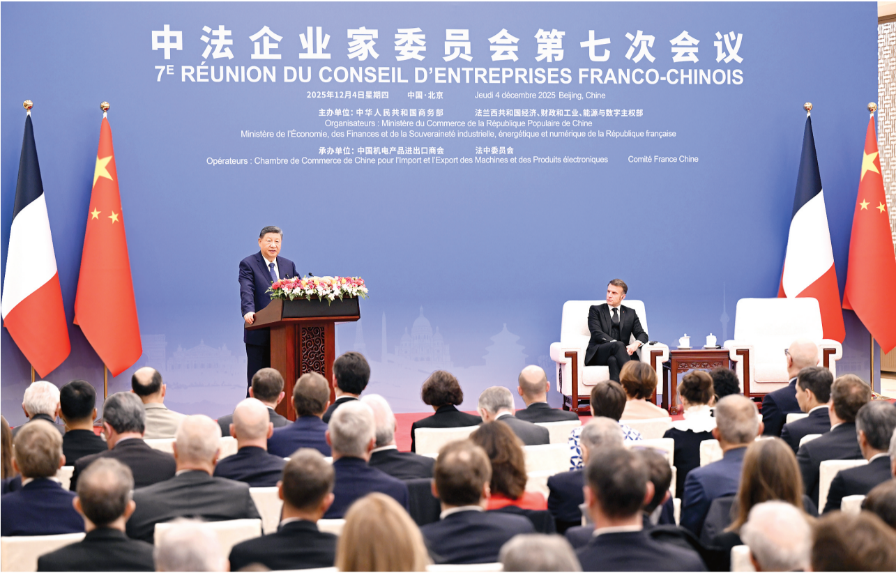
12月4日中午,国家主席习近平在北京同法国总统马克龙共同出席中法企业家委员会第七次会议闭幕式并致辞。

新华社北京12月4日电(记者 董雪 冯欽然)12月4日中午,国家主席习近平在北京同法国总统马克龙共同出席中法企业家委员会第七次会议闭幕式并致辞。 习近平指出,今年是中法关系“新甲子”的开局之年。两国经贸合作领域不断拓展、韧性不断增强。前10个月,双边贸易额达到687.5亿美元,双向投资额累计超过270亿美元。双方要秉持建交初心,抓住机遇、深化合作,推动两国关系行稳致远,共同谱写中法合作更加美好的篇章,以中法关系的稳定性应对当今世界的不确定性。 一是不断拓展双边经贸合作新领域。中方视法方为重要的、不可或缺的经贸合作伙伴,欢迎法方积极参与中国式现代化进程,支持有实力、有意愿的中方企业赴法投资兴业。双方要挖掘人工智能、绿色和数字经济、生物医药、银发经济等新兴领域合作潜力,持续推动产业链供应链开放合作,为两国企业提供公平、透明、非歧视、可预期的营商环境。 二是继续推动中欧互利合作新发展。今年是中欧建交