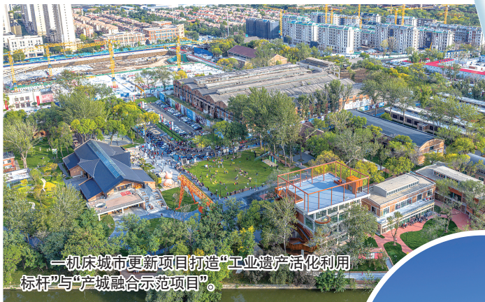
一机床城市更新项目打造“工业遗产活化利用标杆”与“产城融合示范项目”。