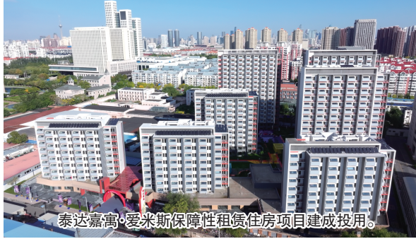
泰达嘉寓·爱米斯保障性租赁住房项目建成投用。

该项目成功入选国家发改委“盘活存量资产、扩大有效投资”典型案例,铸就天津市国有保租房、保障房头部品牌。