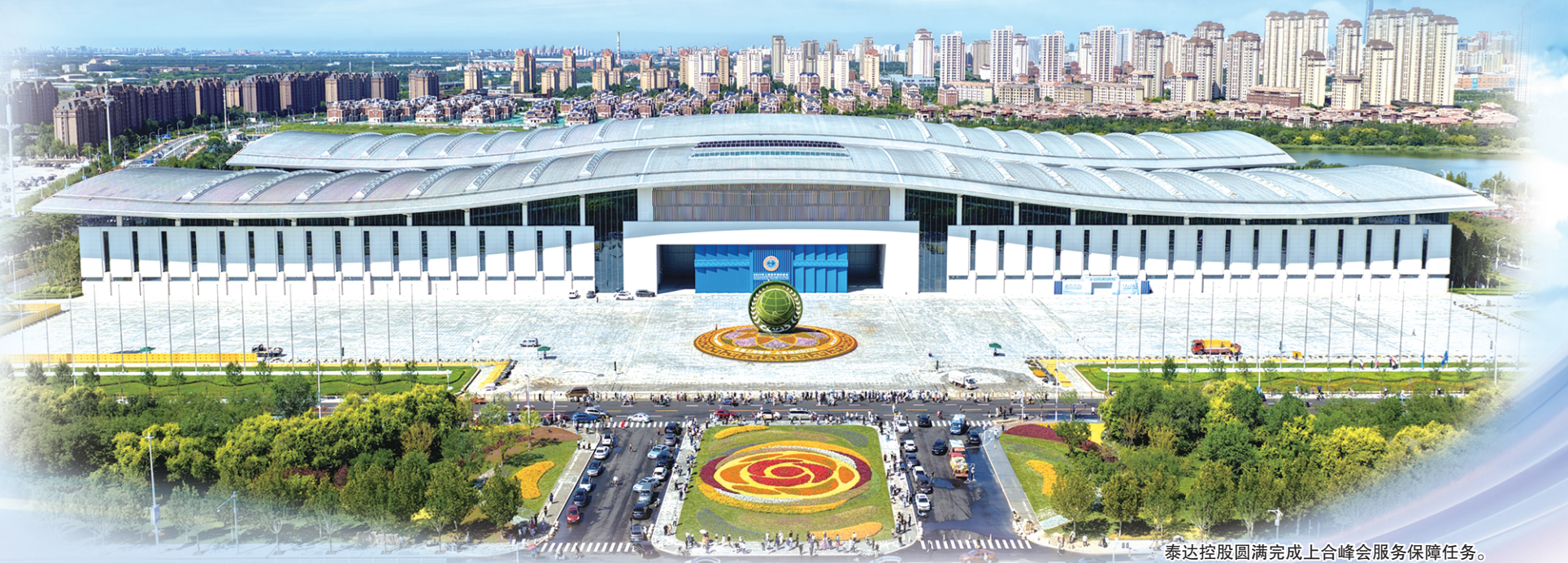
泰达控股圆满完成上合峰会服务保障任务。