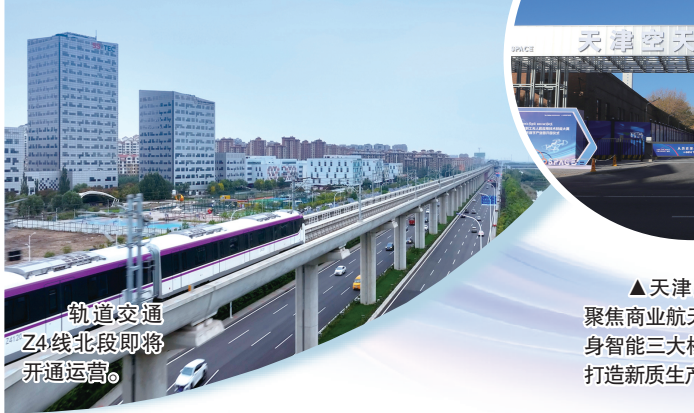
轨道交通Z4线北段即将开通运营。