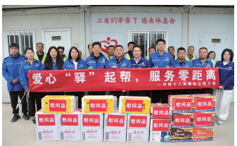
通讯员 韩雪利 詹克文

仪式上,产业工人驿站精心聘任了3名服务志愿者,他们将凭借丰富的服务经验和热情周到的态度,为驿站的持续推进注入新的活力。项目负责人在现场详细汇报了产业工人驿站的创建历程和运营现状,全面展现了驿站为职工服务的坚定决心。