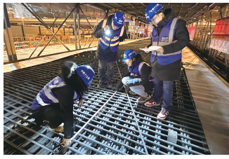
通讯员 郭晓春 魏孔婷

下一步,项目部将持续深化学习全会精神,把学习成果转化为攻克技术难关、保障施工安全的实效,全力将工程打造成为符合首都标准的精品示范工程,为完善现代化综合交通体系贡献力量。