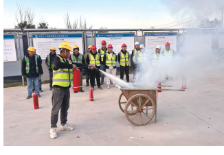
通讯员 张志恒 申军亮

为切实增强施工现场的消防安全意识,压实消防安全责任,昨天,驻津央企中铁十八局五公司雄安启动区慢行绿道一期工程项目部组织开展了“全民消防、生命至上——安全用火用电”消防应急演练活动。本次演练模拟施工现场用火用电引发的突发火情,重点演示干粉灭火器的快速操作步骤与使用方法,强化了人人懂消防、人人会用消防设备的能力。