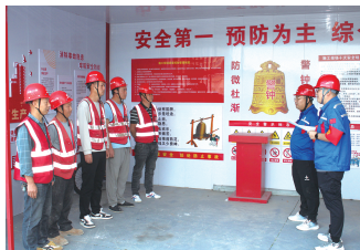
通讯员 韩雪利 于洋

近日,中铁十八局建安公司观澜云启项目部党支部积极推进“共产党员 守护安全”专项活动,划分“党员安全责任区”实行党员包保楼栋,通过组织每日班前讲话、开展安全巡查,组织项目8名党员深入一线排查治理隐患。党员聚焦重点部位、关键工序等,有力解决了队伍在现场生产中遇到的各类问题。