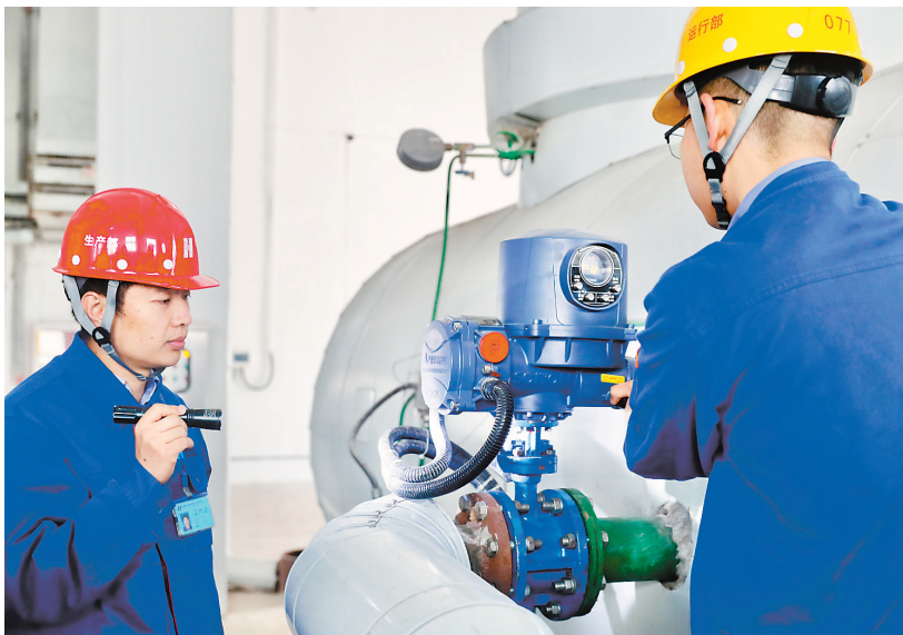
近日,华能杨柳青热电厂开始对一次管网进行升温供热,以确保随时启动辖区供暖。 记者 张磊 摄

市农业农村委党委副书记、副主任刘彤介绍,近年来,天津持续优化农村创业环境,强化政策引导与服务支撑,推动各类人才返乡入乡创业。前三季度,全市农林牧渔业总产值363.2亿元,农村居民人均可支配收入26112元,同比增长5.3%;借助第二十二届中国国际农产品交易会东风,“津农精品”品牌体系持续壮大,225个知名农产品品牌市场竞争力不断增强;农村创业“新热潮”活力迸发,从智慧农场到休闲文旅,从电商直播到精深加工,新产业、新业态、新模式如雨后春笋般涌现,为乡村振兴注入了源源不断的新动能。