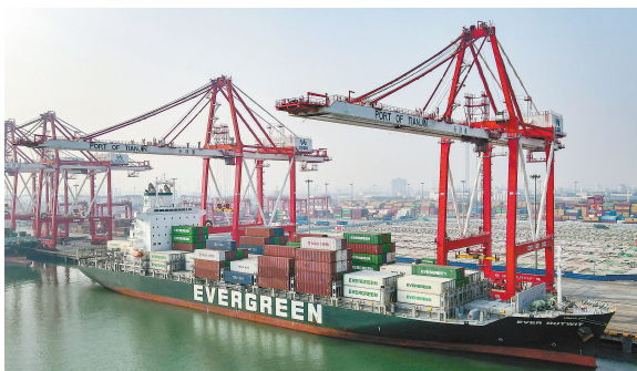
在天津港欧亚国际集装箱码头装卸作业的“长胜”轮,计划驶往印度尼西亚泗水港、雅加达港。