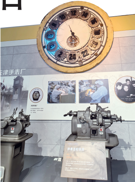
生产海鸥手表的相关机床。

天津的工业记忆，从来不是单一的注脚。红桥区的三条石历史博物馆 5900 余件文物串起从 1860 年秦记铁铺到华北“铁窝子”的兴衰；天津纺织博物馆里，1932 年东亚毛呢纺织公司的“抵羊”商标与立式梳毛机，仍在诉说民族工业的自强……这些散落在城市各处的工业遗产，共同织就了涵盖机械、纺织、建材等多维度的“产业图谱”。