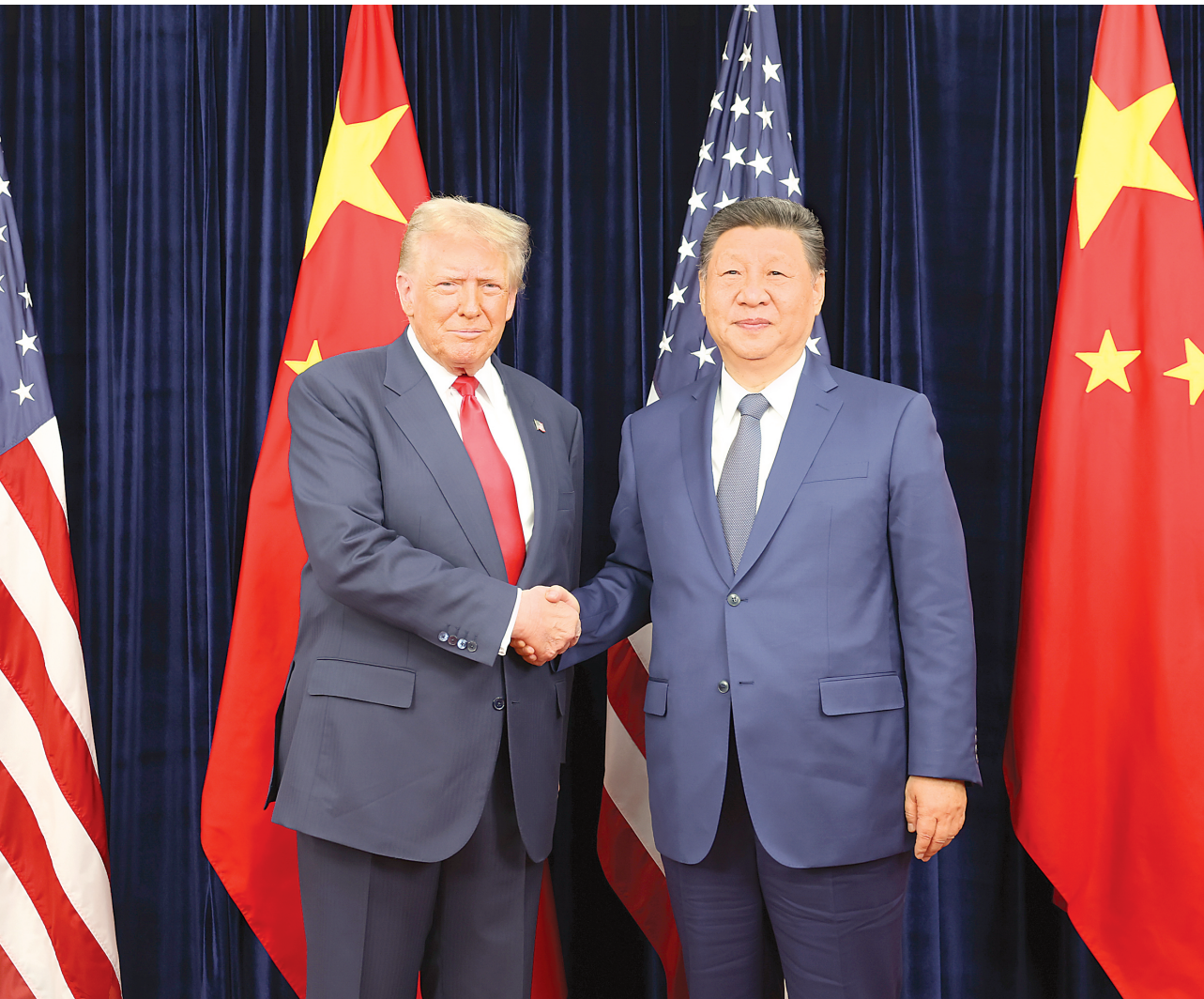
当地时间10月30日，国家主席习近平在釜山同美国总统特朗普举行会晤。