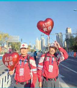
来自天津红十支队的移动救护队提供保障