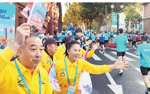
“天马”冠军团成员为选手们助威