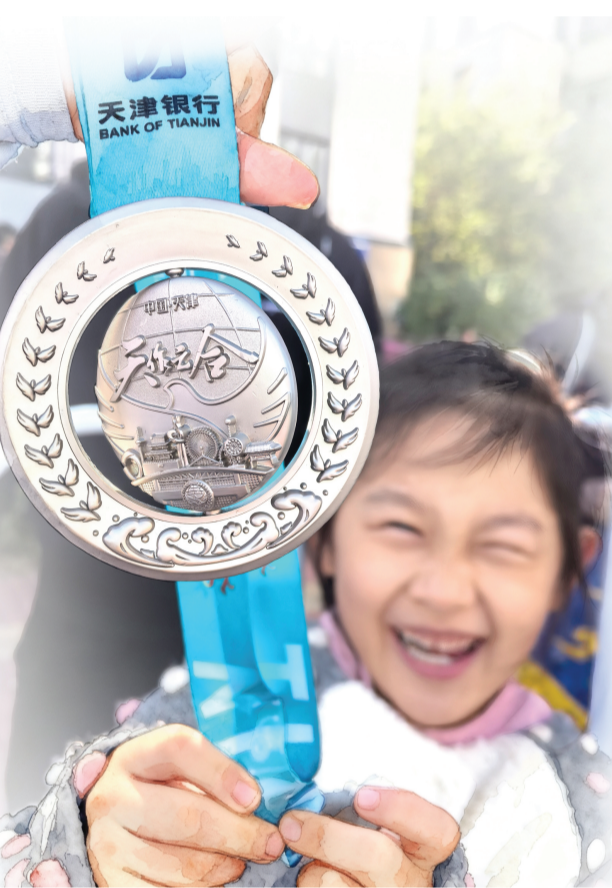
小女孩兴奋地展示妈妈获得的奖牌