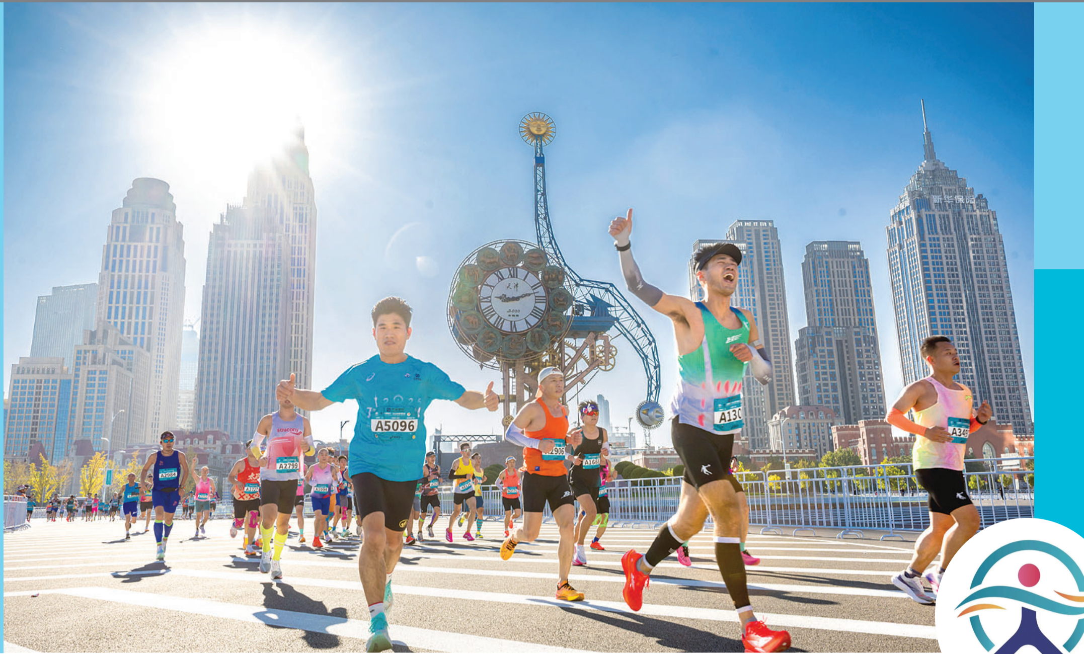
2025 TIANJIN MARATHON

今年是“天马”重回天津市区举办的第3年,该负责人感慨道:“希望通过马拉松赛事更好地展示和宣传天津,这是天津的体育人以及广大市民和热爱体育的朋友们最开心的一件事,希望明年大家可以更好地相聚在天津,向所有人展现一届更好的赛事。” 记者 苏娅辉