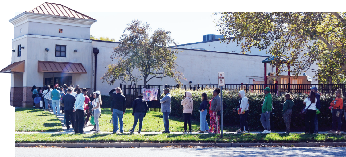
美国政府“停摆”三周,10月21日,在美国马里兰州海厄茨维尔市,联邦雇员排队领取免费食品救济。

文章援引数据分析,美国长期失业者的数量大幅上升。非洲裔等少数族裔群体失业率飙升,因为在当前环境下他们更难找工作。