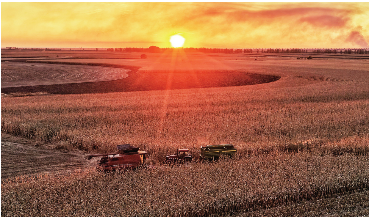
农业农村部最新农情调度显示，2025年全国秋粮收获过六成。图为在黑龙江省佳木斯市同江市街津口赫哲族乡，农户在抢收玉米。

对维护全球粮食安全，习近平总书记有着深邃思考。 生活在同一片蓝天下、拥有同一个家园，世界各国人民应该是一家人。习近平总书记引用“仓廪实而知礼节，衣食足而知荣辱”的中国古语，表达“只有各国人民都过上好日子，繁荣才能持久，安全才有保障，人权才有基础”的深远意涵。 习近平总书记反复强调，“粮食、能源安全是全球发展领域最紧迫的挑战”“全球粮食安全形势严峻复杂”。 报告显示，2024年全球仍有约6.73亿人长期饥饿。非洲超过3亿人面临饥饿，亚洲和南美部分地区虽有改善，但恢复仍不均衡。与此同时，地区冲突、极端气候等进一步加剧了粮食安全风险。 着眼于推动世界实现零饥饿、零贫困目标，习近平总书记在引领中国连续多年实现粮食丰收的同时，积极推出举措、发出倡议努力帮助世界人民解决吃饭问题，展现了深厚的人文情怀和胸怀天下的担当。 对有需要的国家提供紧急粮援—— 关注非洲多个国家受厄尔尼诺现象影响致粮食歉收，向受灾国家提供10亿元人民币紧急粮食援助；向共建“一带一路”的发展中国家提供20亿元人民币紧急粮食援助。 坚持授人以渔，积极输出优良种植品种与技术—— 长期关心菌草技术国际合作，提出“使菌草技术成为造