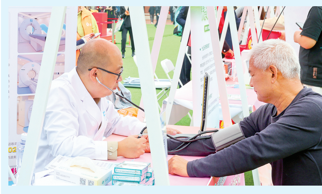
昨日,2025年天津市“敬老月”活动启动仪式在和平区民园广场举行。图为市民现场接受义诊服务。

国情教育、关爱帮扶老年人、为老志愿服务、健康常识普及、老年产品和服务展示、智慧助老、精神文化生活、法律服务等方面,组织开展形式多样的敬老爱老助老活