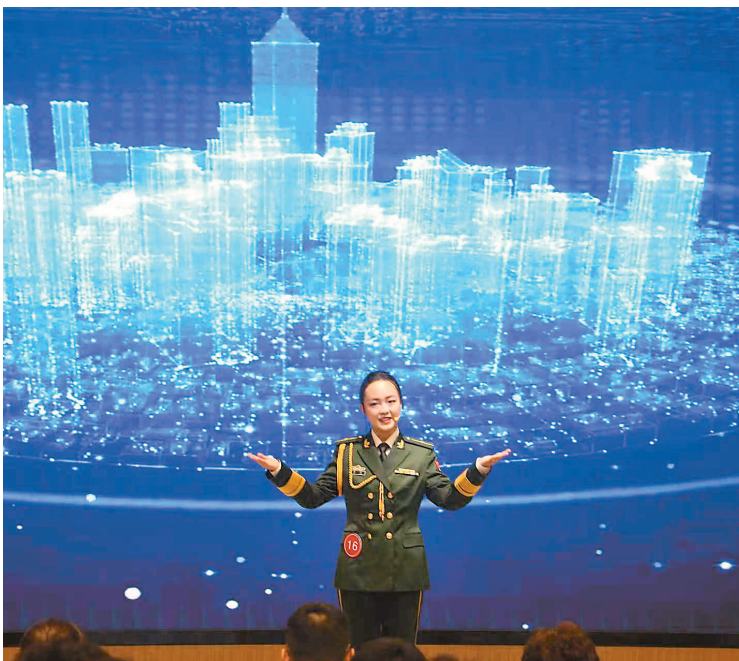
在第十届天津市科普讲解大赛决赛上,选手们运用动画短片、现场实验等手段,通过故事化、场景化表达,让硬核的科学知识更贴近百姓生活。