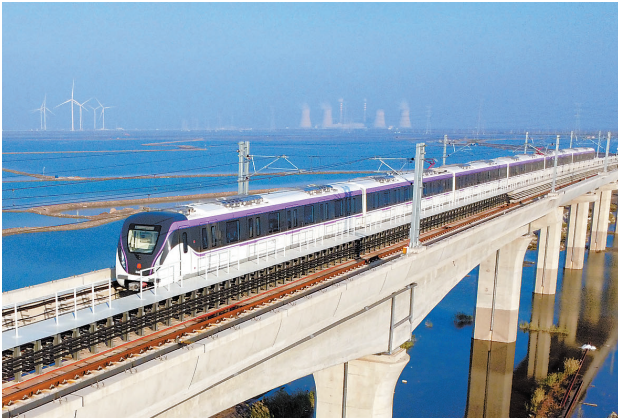
作为天津市今年20项民心工程之一,天津轨道交通Z4线一期工程北段日前启动空载试运行。

把推动城市高质量发展贯穿于“十项行动”,大力推进“三新”、“三量”,加强大城细管、大城智管、大城众管,着力提升城市治理现代化水平,加快建设平安天津、美丽天津,全力服务保障上海合作组织天津峰会成功举行,城市影响力、美誉度、吸引力显著提高。要把走内涵式发展路子作为转变城市发展方式、建设现代化人民城市的关键所在,坚持因地制宜、分类施策,充分发挥区位优势、港口、科教人才、产业、城乡空间资源等优势,更加突出存量盘活、创新驱动、绿色转型、职住平衡、商贸文旅深度融合,不断提高经济效益、生活品质、生态质量、文明素养、治理效能,牢牢守住城市安全底线,推动国际化、智能化、绿色化、人文化发展,探索形成现代化大都市建设新路径。 陈敏尔强调,要优化城市结构,深度融入京津冀城市群,持续完善市域空间布局,扎实推进城乡融合发展,进一步提高城市综合承载能力。要抓好存量盘活,更多运用改革思路和法治化、市场化方式,增强资源资产盘活质效,提高科创园区建设运营水平,加强基础设施建设改造,进一步推进城市更新提升。要突出创新驱动,深入推进科技创新,大力推动产业焕新,广泛集聚优秀人才,培育和发展新质生产力,进一步加快城市发展动能转换。要坚持人民至上,把保障居民安居乐业作为头等大事,提高城市生活品质,推动城市绿色低碳转型,进一步加强宜居韧性城市建设。要扩大对外合作,构建更高水平开放型经济新体制,深化港产城融合发展,提升贸易投资合作水平,打造我国北方地区联通国内国际双循环的重要战略支点,进一步凸显城市开放包容特质。要推动文化传承,培育滋养城市文明,赓续发展城市文脉,强化商贸文旅服务,繁荣发展地域特色文化,进一步增强城市文化软实力。要深化“大城三管”,在细管上精益求精、在智管上拓展赋能、在众管上凝心聚力,进一步提升城市治理质效。 陈敏尔强调,要加强党的全面领导,健全领导体制和工作机制,强化统筹推进和督促指导,形成市区联动、部门协同、全市“一盘棋”的工作局面。树立和践行正确政绩观,始终把实现人民群众对美好生活向往作为城市工作的出发点和落脚点,积极借鉴国内外先进经验,建立健全科学的城市发展评价体系,确保“一张蓝图绘到底”,让人民群众不断有新的获得感。加强专业素质和能力建设,增强党员干部领导城市工作、推动城市发展的本领,加强城市发展重大问题调查研究,着力培养善建、善管、善营的干部队伍和各类人才,培育专业特色智库,为推动城市高质量发展夯实人才智力支撑。 张工在主持中强调,要持续深化对习近平总书记任中央城市工作会议上重要讲话精神的领会贯彻,科学把握“两个转向”重大判断,坚持走内涵式发展路子,进一步增强做好新时代城市工作的责任感使命感。要统筹推进重点任务,聚焦京津冀城市群发展和建设创新、宜居、美丽、韧性、文明、智慧城市,以钉钉子精神抓好各项工作落实。要凝聚形成工作合力,进一步健全机制、压实责任,把城市工作深度融入本地区本部门“十五五”规划,更好满足城市发展所需和群众生活所盼,齐心协力在全面建设社会主义现代化大都市进程中展现新的更大作为。 会议以电视电话会议形式召开。市委各部委、市级国家机关有关部门、各人民团体、市管企事业单位、部分中央驻津单位负责同志等在主场参会。各区设分会场。