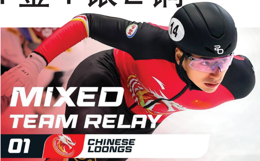
凭借刘少昂的“绝杀”,中国队获混合接力金牌。

此外在首站比赛中,荷兰选手维尔泽波尔和加拿大选手萨劳特分获女子500米和1500米金牌,韩国选手林钟彦夺得男子1500米冠军,加拿大名将丹吉努摘得男子500米金牌,加拿大选手萨罗轩获女子1000米冠军,女子3000米接力金牌归属韩国队。韩国队和加拿大队以3枚金牌并列金牌榜首位,第二站世巡赛将于当地时间10月16日至19日继续在蒙特利尔进行。