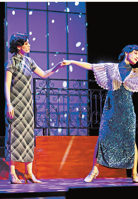
日前,民国悬疑双女主音乐剧《蝶变》天津站演出在天津大剧院上演。

现场互动环节将突出津味和五感体验。天津展区3天内将开展15场互动体验活动,打造视觉、嗅觉、听觉、味觉、触觉全方位沉浸体验。参展工作领导小组负责人表示,版博会是展现天津版权实力与津味文化魅力的重要窗口。天津展团将以最佳状态亮相,力争展示有亮点、交易有成果、合作有突破,向全国乃至世界讲述鲜活的天津版权故事,为全国版权产业高质量发展贡献天津力量。