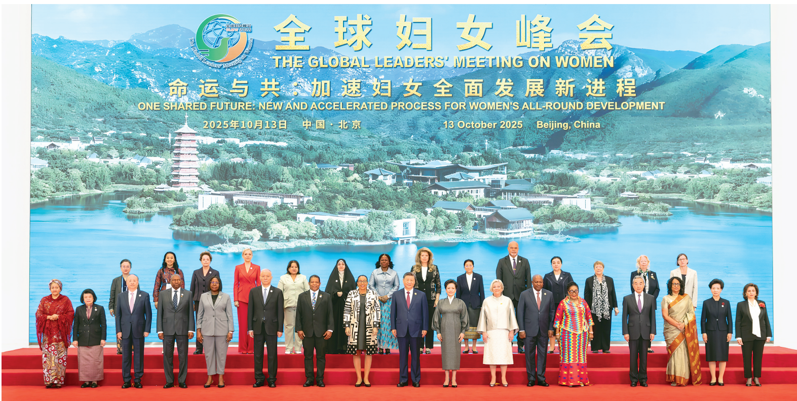
10 月 13 日上午，国家主席习近平在北京国家会议中心出席全球妇女峰会开幕式并发表主旨讲话。这是习近平和夫人彭丽媛同与会各国和国际组织代表团团长夫妇合影留念。

球妇女事业蓬勃发展，为人类文明进步增添了亮丽色彩。追求男女平等已经成为国际社会普遍共识，妇女赋权取得显著进步，女性受教育水平不断提高，在经济、政治、文化、社会生活中发挥着更加重要的作用。一大批杰出女性走上国际舞台，演绎精彩人生、贡献智慧力量。 习近平强调，当前，妇女全面发展仍然面临复杂挑战，实现男女平等任重道远。展望未来，各方要重温北京世妇会初心，为加速妇女全面发展新进程凝聚更广泛共识、开辟更广阔道路、采取更务实行动。习近平提出 4 点建议： 第一，共同营造有利于妇女成长发展的良好环境。要秉持共同、综合、合作、可持续的安全观，维护世界和平。加强对战乱冲突、贫困灾害地区妇女和女童的保护。健全和完善反暴力机制，坚决打击针对妇女的一切形式的暴力行为。 第二，共同培育推动妇女事业高质量发展的强劲动能。要着力解决全球妇女发展不平衡