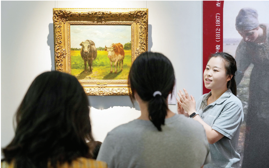
日前,天津数字艺术博物馆举办的“艺览西洋——跨越时空的对话”西方美学艺术展迎来展品更新。

坐落于和平区承德道的法国公议局旧址是全国重点文物保护单位。2023年,这座老建筑焕发出新生机,艺术性与时尚感兼具的天津数字艺术博物馆在这里全新亮相。自开馆以来,这里举办了很多风格各异且充满新意的艺术展览与活动。深耕数字技术的同时,该馆还积极拓展多元服务场景,打造集快闪店、咖啡厅、珠宝定制