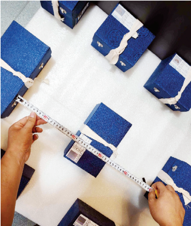
技术人员测量文物包装之间的距离,确保运输途中不互相碰撞。