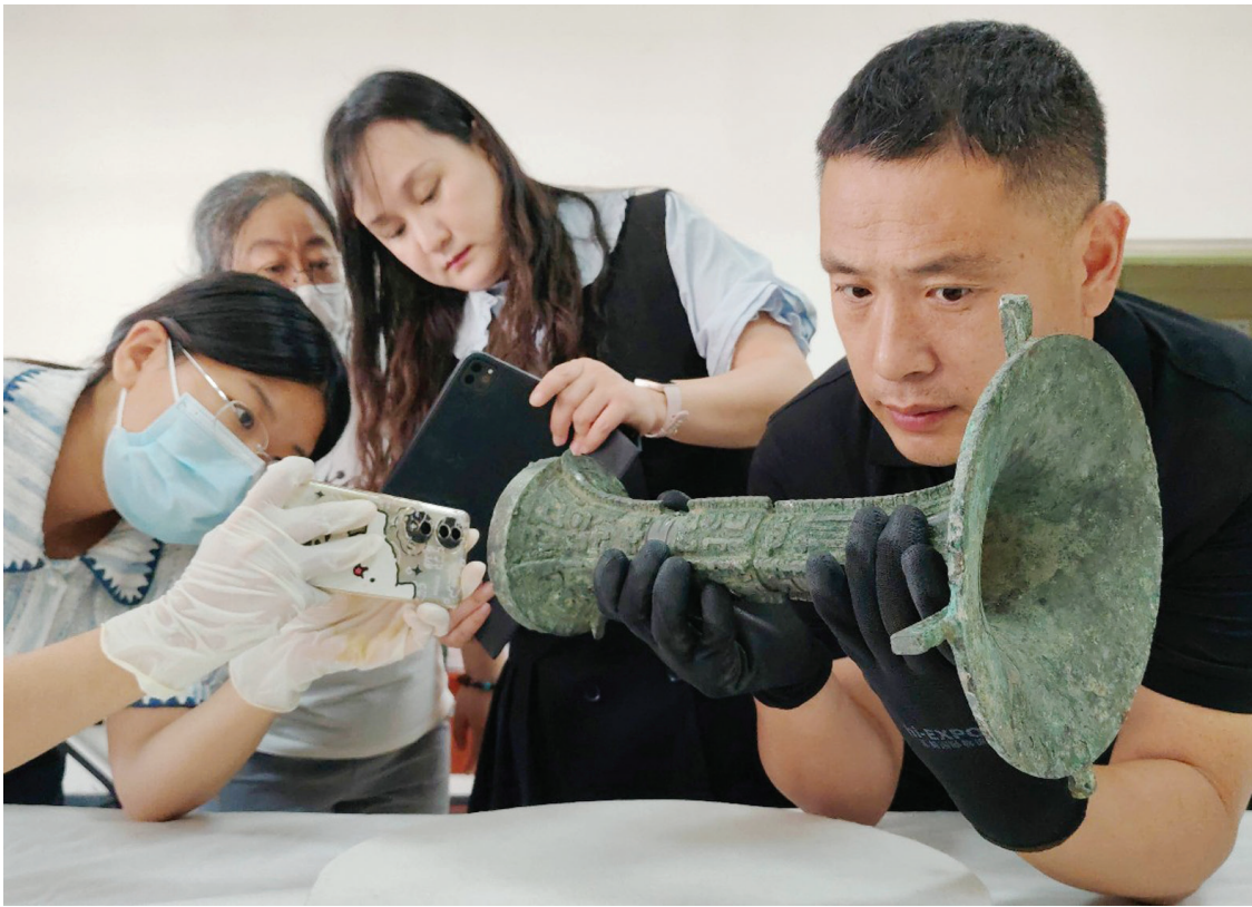
文物点交过程中,工作人员对文物进行拍照记录。