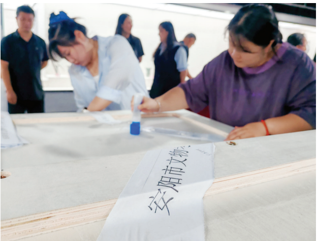
封紧螺丝再贴上封条。