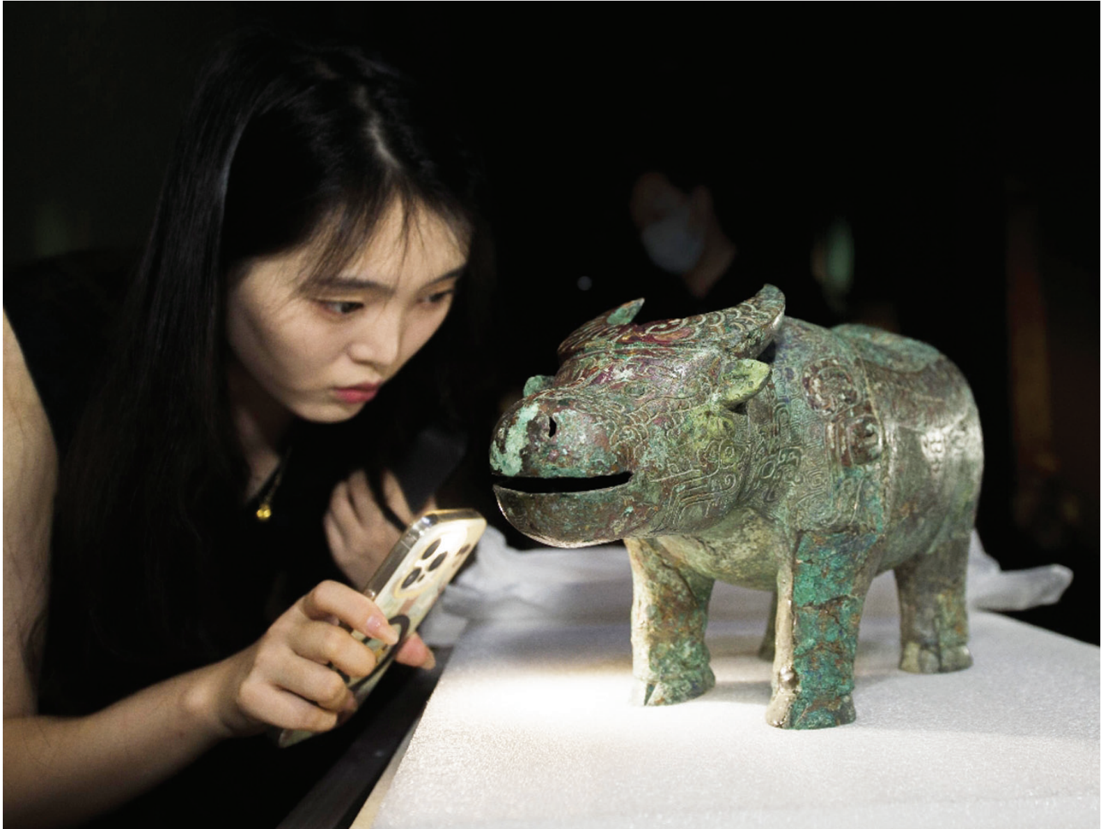
国宝亚长牛尊在天津博物馆开箱后,工作人员对文物进行认真核对检查。