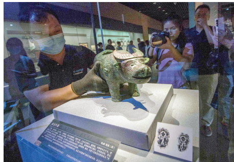
亚长牛尊被工作人员小心翼翼摆进天津博物馆展柜。

文物运输从来不是简单的搬运,而是融合考古学、物理学、工程学的精密科学。每一次开箱、每一毫米的缓冲,都是现代人对古老文明最郑重的承诺。