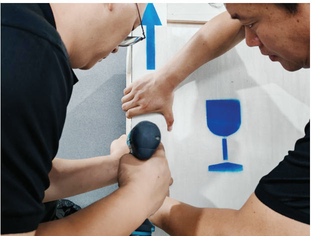
装好文物后,包装箱用螺丝封紧。