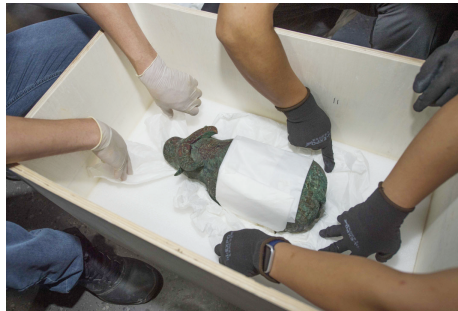
技术人员小心翼翼剥开殷墟博物馆镇馆之宝亚长牛尊的包装。