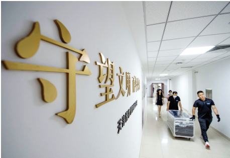
国宝文物陆续抵达天津博物馆。