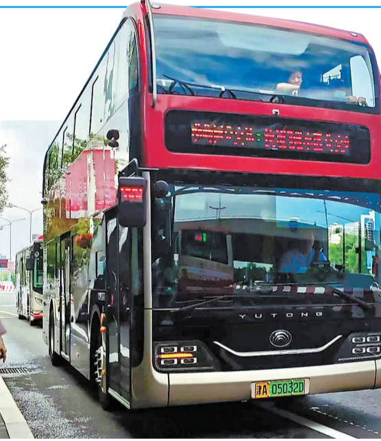
近日,天津公交巴士公司在快速1路投用新能源双层公交车。