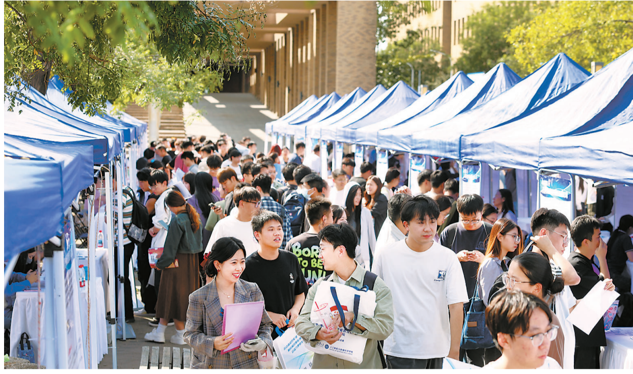
昨天,2025天津市“海河英才”高校专场招聘活动在天津工业大学举办。

本报讯(记者 姜凝)9月18日,由人社局主办的2025“双一流”高校校园招聘活动在天津工业大学举办。此次活动是2025天津市“双一流”高校校园招聘秋季招聘系列活动之一,以天津工业大学为主会场,辐射周边高校毕业生,以吸引更多高校毕业生在津施展才华、干事创业。来自全市的重点企事业单位200余家,提供了材料、机械、自动化等多个领域的优质岗位4000余个。据了解,此次招聘活动共吸引5000余人次现场求职咨询,收取简历8900余份,1600余人达成初步意向。