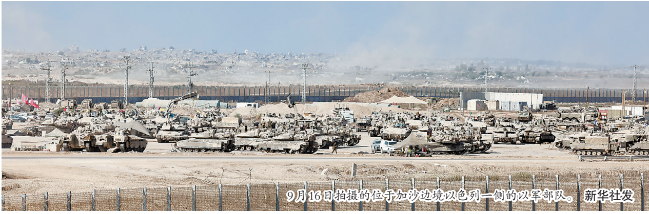
9月16日拍摄的位于加沙边境以色列一侧的以军部队。

以色列国防部长卡茨8月19日与以军总参谋长扎米尔及其他高级军官,以国家安全总局(辛贝特)官员举行会议,