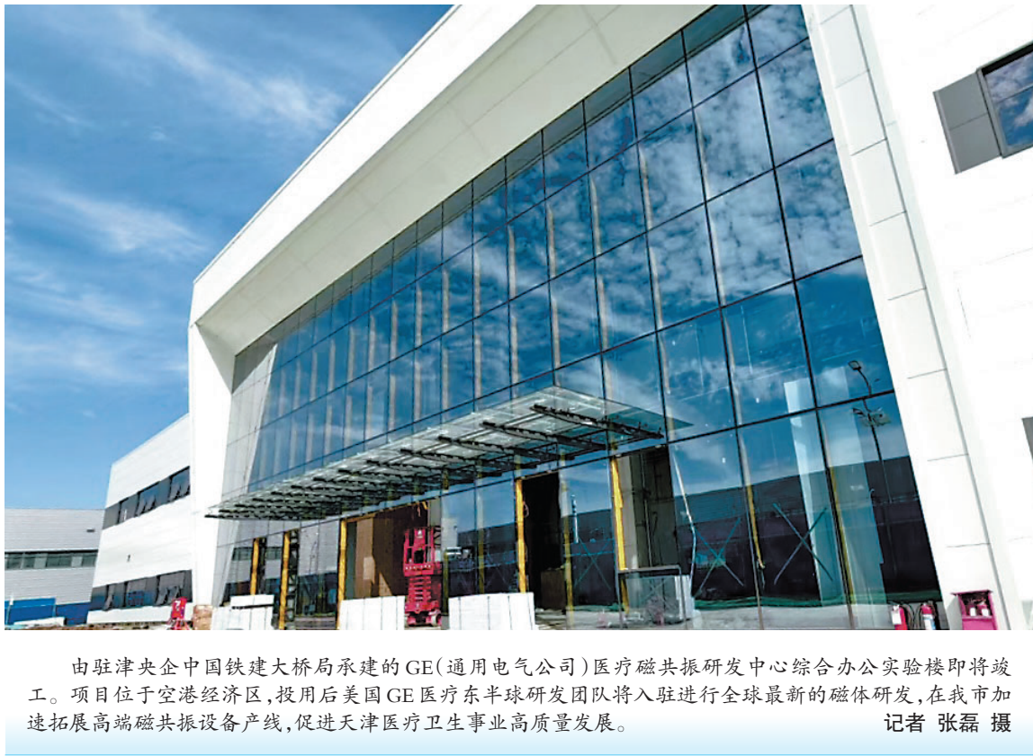
由驻津央企中国铁建大桥局承建的GE(通用电气公司)医疗磁共振研发中心综合办公实验楼即将竣工。项目位于空港经济区,投用后美国GE医疗东半球研发团队将入驻进行全球最新的磁体研发,在我市加速拓展高端磁共振设备产线,促进天津医疗卫生事业高质量发展。

“以往,我们一般通过书面或远程连线的方式给法庭提供技术支持,如今能在现场即时回应技术疑问,协助法官快速厘清争议焦点、精准认定事实,缩短案件审理周期。”滨海保护中心相关负责人表示,“我们选派了两名经验丰富的技术骨干进驻法庭,通过参与司法审判流程,技术调查官依托专利预审工作积累形成的专业视角和经验,能够与法官的法律思维形成有效互补,共同提升对涉案技术问题理解的准确性。”截至目前,该保护中心已有14人被天津市第三中级人民法院聘任为技术调查官,多次参与技术类案件庭审,并出具技术调查意见,为案件的公正、高效审理提供有力支撑。