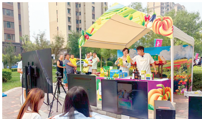
东丽区“新烟火”市集,通过线上直播销售葡萄。

主旨报告环节,与会学者围绕“自主知识体系建设的创新实践”“世界之变与中国之学——构建中国自主知识体系的政治学之维”“从自主知识体系迈向教材建设实践”“关于‘自主’与‘智库’的关系问题”“科学世界观的坚持运用与中国自主知识体系构建”“中国自主知识体系构建的文化根基”等展开深入探讨。同步开设了教育学、心理学、语言文学、世界史、政治学、马克思主义理论、电影学、国际中文教育和社会科学交叉创新研究等9场平行分论坛,设置了106场交流报告,为推进中国特色哲学社会科学“三大体系”建设搭建了高层次、跨学科交流平台。