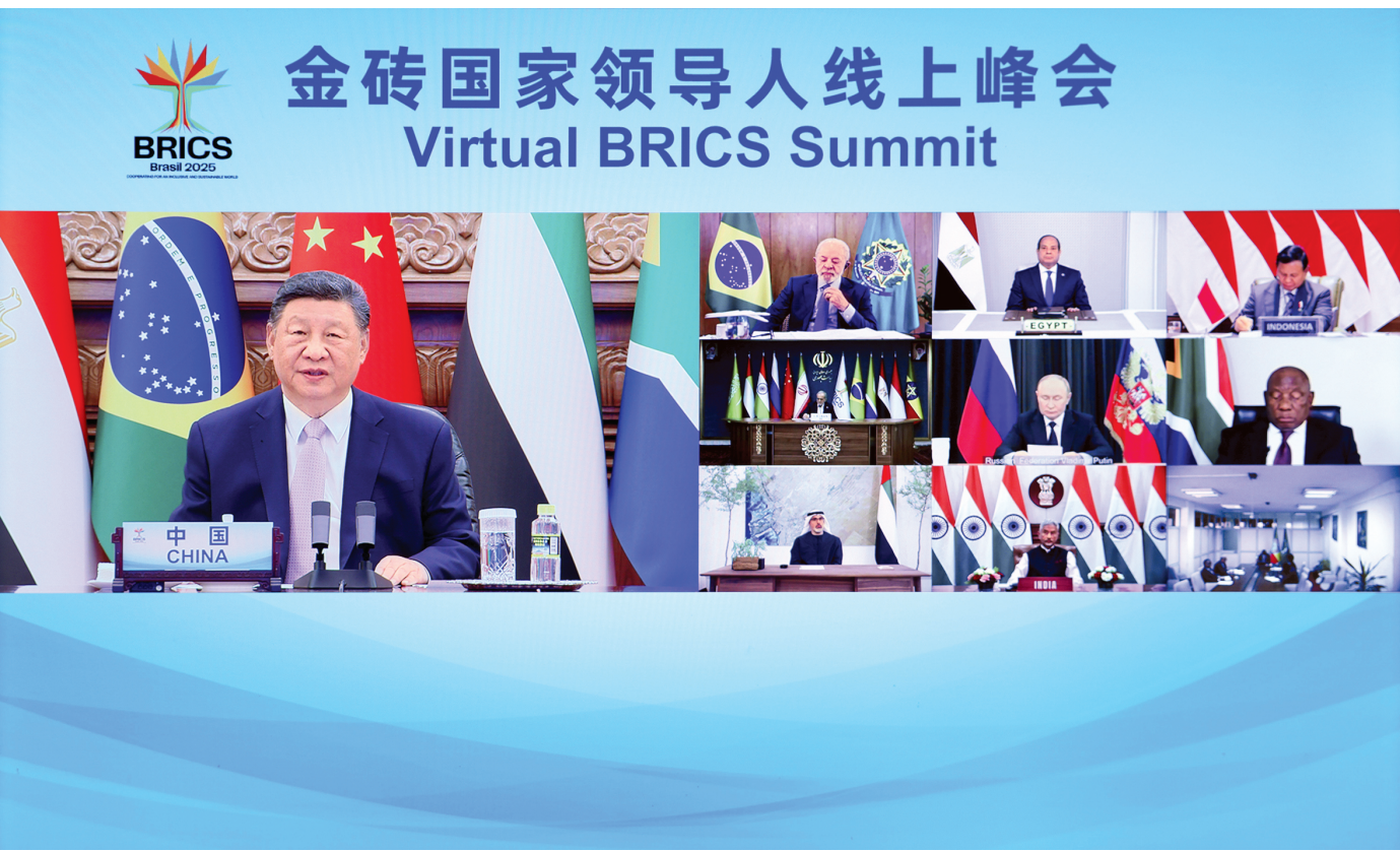
9月8日晚,国家主席习近平出席金砖国家领导人线上峰会,并发表题为《团结合作 砥砺前行》的重要讲话。

新华社北京9月8日电(记者 杨依军 邵艺博)9月8日晚,国家主席习近平出席金砖国家领导人线上峰会,并发表题为《团结合作 砥砺前行》的重要讲话。 巴西总统卢拉主持峰会,俄罗斯总统普京、南非总统拉马福萨、埃及总统塞西、伊朗总统佩泽希齐扬、印度尼西亚总统普拉博沃、阿联酋阿布扎比王储哈利德以及印度、埃塞俄比亚代表与会。 习近平指出,当前,世界百年变局加速演进,霸权主义、单边主义、保护主义甚嚣尘上。金砖国家作为全球南方第一方阵,要坚持弘扬开放包容、合作共赢的金砖精神,共同捍卫多边主义,维护多边贸易体制,推进“大金砖合作”,携手构建人类命运共同体。