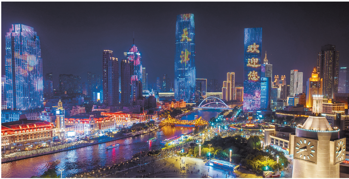
天津海河夜景(无人机照片)。