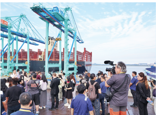
昨日,媒体记者参观天津港「智慧零碳码头」。

参访活动中,一张张现场图片、一组组对比数据、一个个生动故事……把中外嘉宾“带人”到鲁班工坊从建设到揭牌、再到培养大批合作国本土技能人才的一段段历程中。大家纷纷表示,鲁班工坊不仅为国际职业教育交流合作搭建了重要平台,更架起了促进人文交流、民心相通的桥梁,是“和合共生”理念的生动实践。