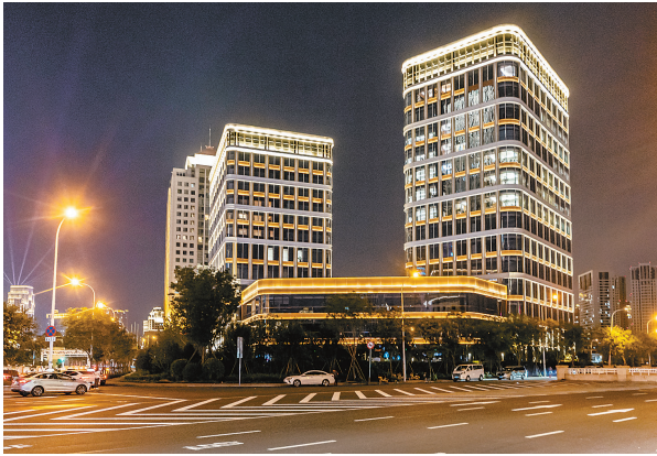
华为天津区域总部。

适配器”至2.0版,汇集各级政策2600余条,通过企业画像智能匹配,点击量近9万次,实现政策精准高效触达。 这样的服务升级并非个例。天津以数字赋能城市治理,实现从“分散管理”向“全域协同”转变:“津心办”接入政务服务事项1500余项,“津治通”支撑办结各类事项超2700万起……一网通办让城市运转更加高效。 多点布局,汇聚优势—— 天津港保税区依托智慧港口与数字产业集群的坚实基础,凭借数字贸易与数据跨境的创新优势,正全面发力数字经济;滨海新区加快建设“中国信创谷”,已引飞腾、麒麟、曙光、海光、三六零等200余家重点信创企业;河北区依托天津市人工智能计算中心、华为天津区域总部两大“招牌”,磁吸人工智能、数据及智能网联车等产业集聚……如今,各区立足区位优势,聚焦特色优势,探索出一系列创新案例,为全市数字经济发展提供了坚实支撑。 开放协同,数联八方—— 数字脉搏强劲,合作正当其时。前不久来津参加2025上合组织数字经济论坛的埃及前国家行政发展部长、前苏伊士运河经济区主席艾哈迈德·达维史博士表示:“数字经济是新时代的丝绸之路,它通过数据来连接,而不是跨过山谷与沙漠。” 天津坚持高水平开放,深入参与上合组织国家数字经济合作,形成一批具有示范引领效应的成果:国家物流数据开放互联互通首条多式联运示范线路在津启运;中国(天津)自由贸易试验区取得数据跨境领域“双首个”制度创新成果;天津21个数字经济项目在2025上合组织数字经济论坛上签约,8个案例入选中国—上合组织国家数字经济合作典型案例。 津品(天津)管理咨询有限公司与乌兹别克斯坦塔什干东方瑞士有限公司合作的“乌兹别克斯坦电商生态体系建设”案例,便是天津8个人选案例之一。“我们在乌兹别克斯坦首都塔什干建了天津首个中亚海外仓,当地居民今天下单,明天就可以收货。”该公司董事长万晓文表示,目前,已有3000多款中国产品通过他们搭建的平台走进中亚市场,交付期从30天压缩到5天,物流成本减少40%。 从数据变现到产业焕新,从城市智治到开放共赢,天津以“数字化+产业化+产品数字化”双轮驱动,走出了一条数据要素改革的新路径,为全国提供了可复制、可推广的实践经验。 “我们将积极开展先行先试,进一步扩大对外开放,不断探索数据要素市场化价值化的有效路径,全力打造数字赋能创新高地、数实融合发展高地、数字开放合作高地,为全球数字生态贡献‘天津智慧’。”天津市数据局副局长周胜普说。 潮涌渤海,“数”创未来。天津正以“数”为翼,以“融”为帆,在高质量发展新征程上奋楫争先、踏浪前行。