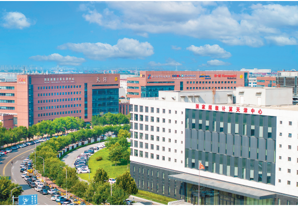
天河数字产业园。