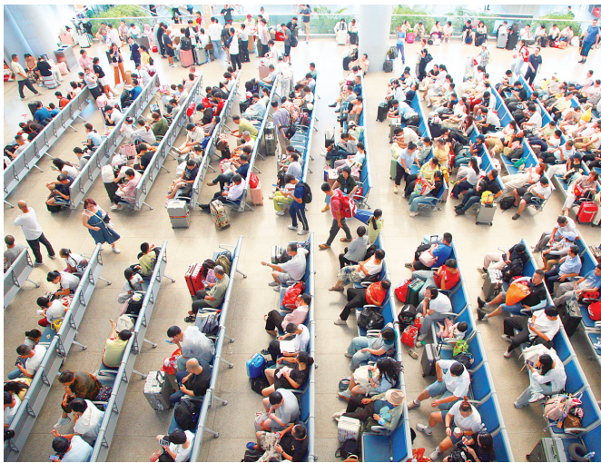
8月24日,旅客在江苏南京火车站候车。