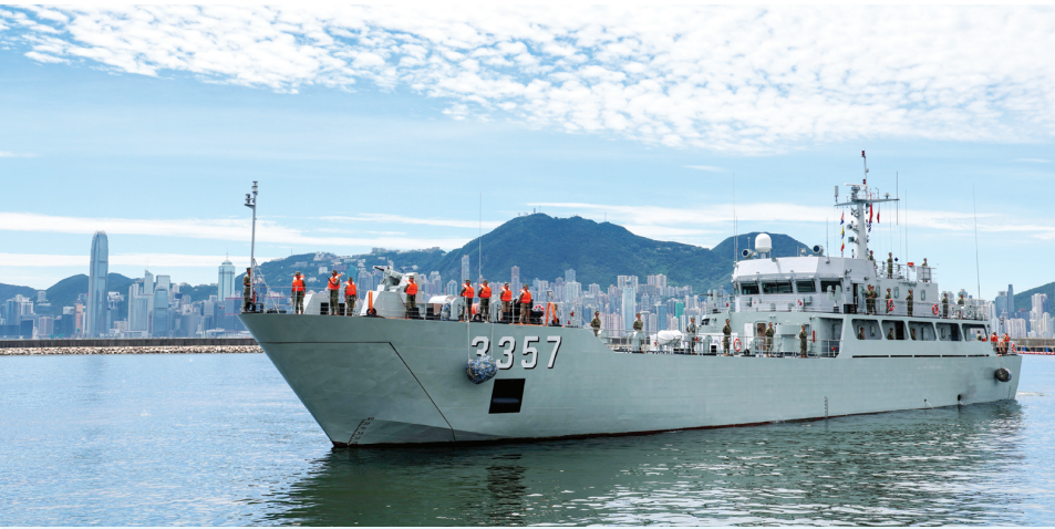
根据《中华人民共和国香港特别行政区驻军法》和中央军委命令,中国人民解放军驻香港部队于8月22日组织了第28次建制单位轮换,轮换行动于当晚顺利完成。