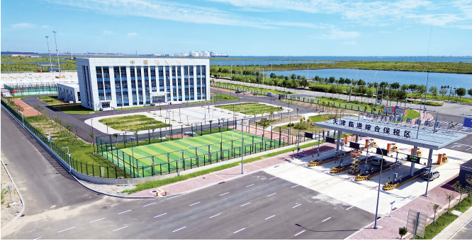
天津临港综合保税区。

本报讯(记者 马晓冬)昨日,海关总署会同国务院相关部门对天津临港综合保税区开展正式验收,签署验收纪要并颁发验收合格证书。这标志着天津临港综合保税区已具备封关运作条件,我市开放型经济再添发展新引擎。 作为海关特殊监管区域,综合保税区具有开放层次高、优惠政策多、功能齐全、监管流程简化等特点,是高水平对外开放的平台载体,对发展对外贸易、吸引外商投资、促进产业转型升级具有重要作用。2023年6月5日,国务院批复设立天津临港综合保税区,规划面积5.56平方公里,陆上边界全长8.4公里,海上边界全长6.2公里。昨日,验收组听取了天津临港综合保税区建设主体的现场汇报,实地查看隔离围网、卡口设施等建设情况,经评审,天津临港综合保税区的基础和监管设施符合相关规范要求。 此次通过验收后,天津临港综合保税区将发挥区位优势,利用临港区域码头岸线资源,探索建立“货物贸易+服务贸易”的功能体系,打造国际贸易、物流分拨、展示交易、检测维修、金融服务和研发制造六大核心功能。同时,立足海洋工程装备产业,重点打造海洋经济、氢能等标志性产业链,为区内优势产业提质增效提供支持。 目前,我市已拥有5个综合保税区,分别为天津港综合保税区、天津泰达综合保税区、天津东疆综合保税区、天津滨海新区综合保税区和天津临港综合保税区。