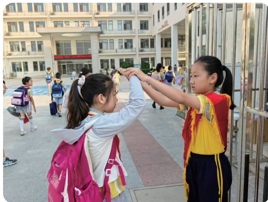
5月，北辰区实验小学注重提升学生文明礼仪意识，组织各项生动实践活动，如在校门口设立“文明监督岗”，通过规范、监督日常礼仪行为，潜移默化地培养学生文明习惯，传承城市文明精神。