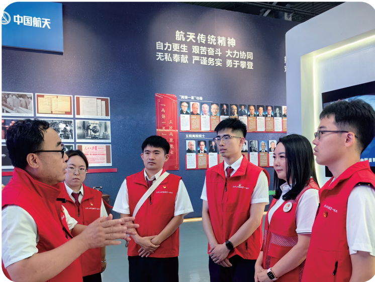
7月30日，中国民航大学教师在中国航天科技集团五院天津基地为四十三中学、芦台第一小学师生宣讲“高质量发展背后的故事”。