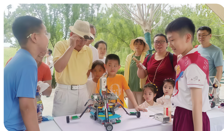
5月31日，天津市和平区万全小学在银河广场开展科普讲解活动。