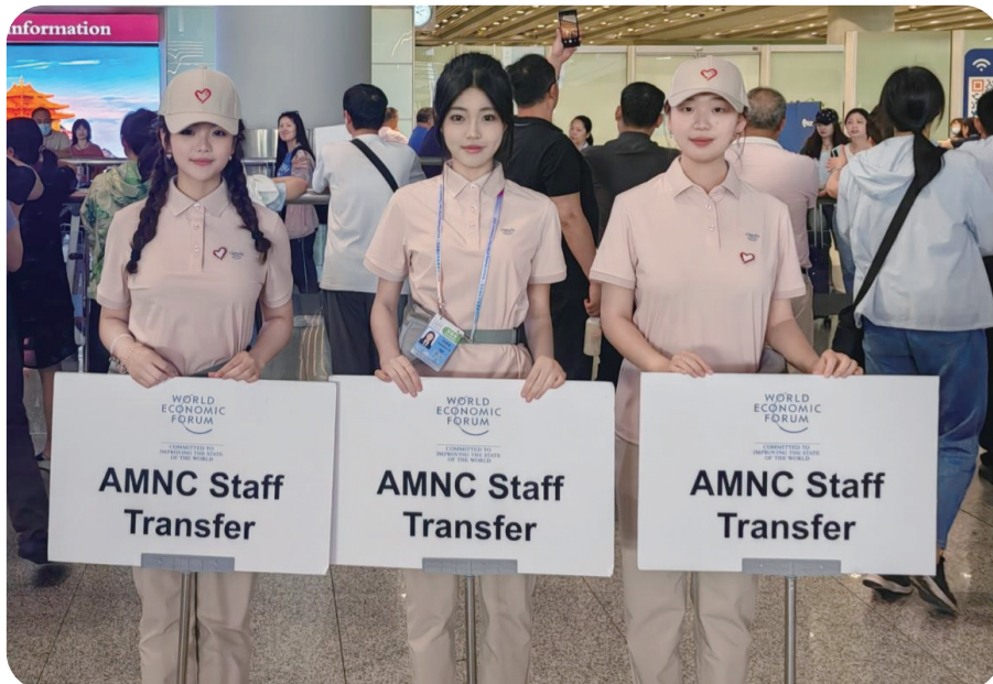
6月20日，天津财经大学80名志愿者投入到第十六届夏季达沃斯论坛的交通保障工作中，他们以双语能力与温暖笑容迎接全球来宾，举手投足间尽显礼仪之邦的文明风范。