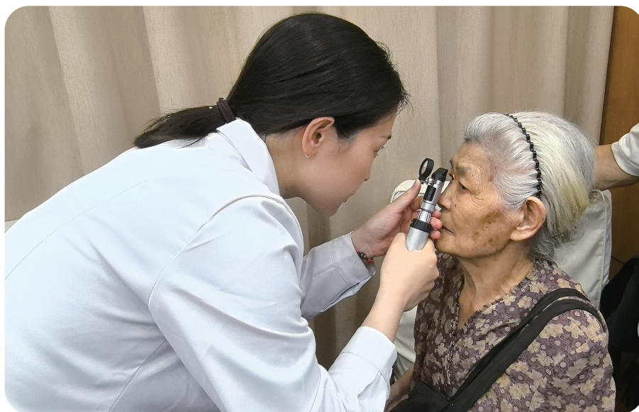
6月6日第30个全国“爱眼日”，天津医科大学眼科医院医务工作者走进和平区部分社区、学校开展义诊宣教活动。图为医务工作者正在为老人进行眼部检查。