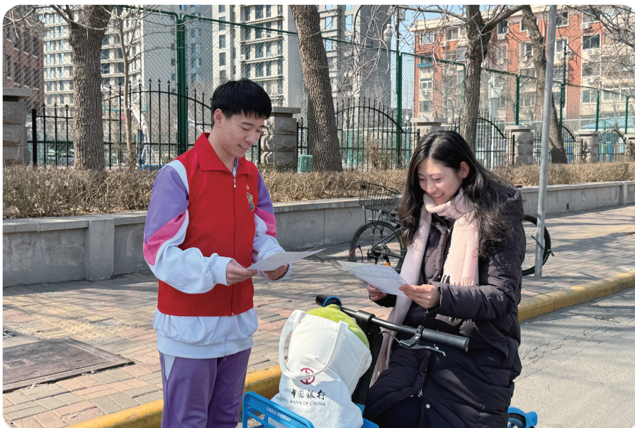
3月21日，天津市第二十一中学组织学生开展了以“文明出行，你我同行”为主题的志愿服务活动，他们有序走上街头，向市民宣传文明出行知识，协助维持交通秩序，用实际行动践行雷锋精神。