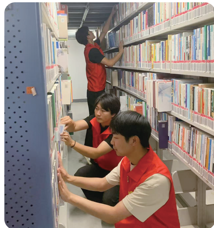
6月8日，天津工艺美术职业学院组织15名志愿者前往天津图书馆参加图书整理志愿服务活动，以实际行动践行志愿服务精神。