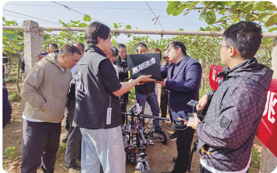
4月23日，天津理工大学教师为陕西宝鸡眉县猕猴桃果农及农机商讲解该校自主研发的机器人智能授粉技术，服务国家战略，以创新科技赋能乡村振兴。