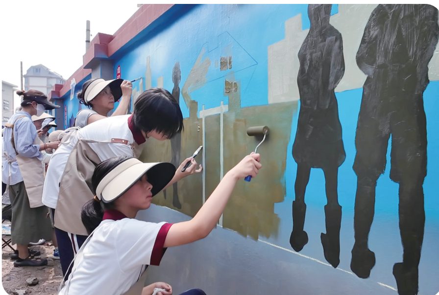
6月30日，在南开区少年宫美术老师的悉心指导下，天津美术学院、天津师大南开附中、区少年宫的大中小学生，用画笔将南开誉英学校的围墙化作巨型涂鸦墙，用斑驳色彩描绘了“文明天津”“文明南开”，彰显深厚文脉。