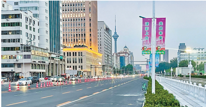
近日,地铁 7 号线六里台站完成退路,缓解了卫津路沿线的交通压力。