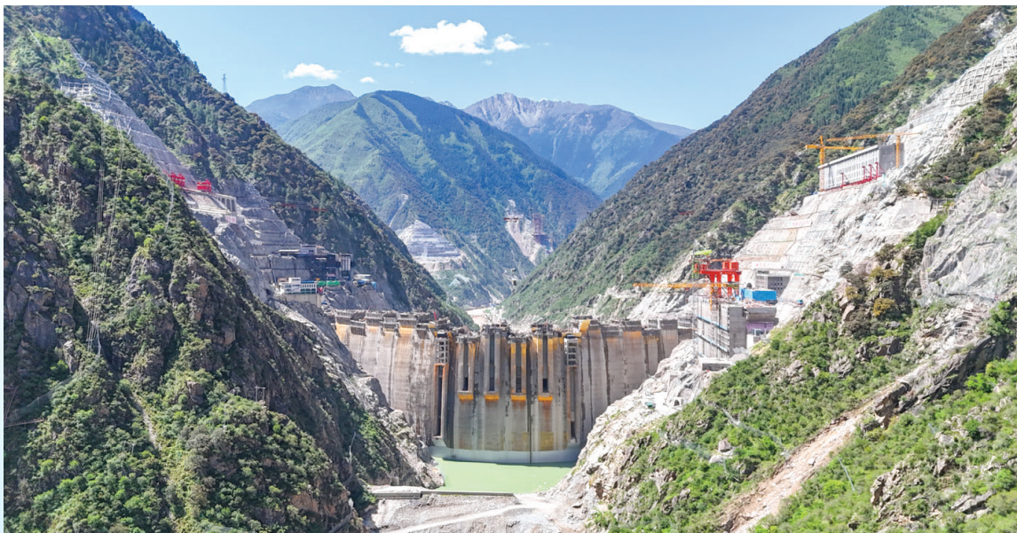
建设中的叶巴滩水电站。该水电站地处四川甘孜州白玉县与西藏昌都市贡觉县交界处的金沙江上游。