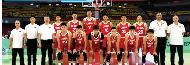
中国男篮此前与委内瑞拉队友谊赛前合影。

据悉,中国男篮将于今天启程前往沙特阿拉伯吉达,为亚洲杯进行最后的备战冲刺。2025年男篮亚洲杯将于当地时间8月5日至17日在沙特阿拉伯举行。中国男篮被分入C组,同组对手包括沙特阿拉伯、印度和约旦队。