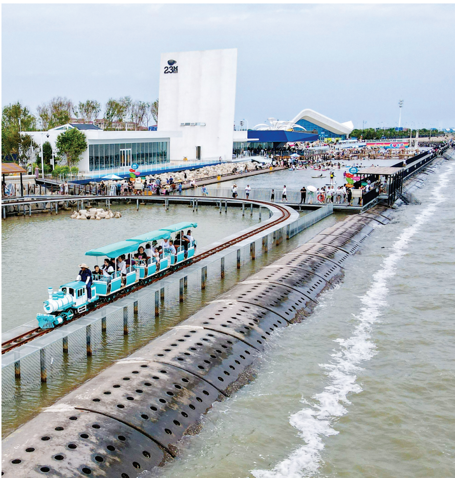
入伏后,持续高温带动避暑游热潮,东疆海贝乐园内游人如织。