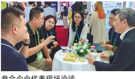
参会企业代表现场洽谈。