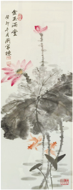
金玉满堂(中国画) 刘家栋

嘉兴水乡之地,自然与烟雨有不解之缘。此地西塘有烟雨长廊,南湖湖心岛上则有烟雨楼。六年前去西塘,才始知有烟雨长廊。而从小读历史和诗词,就知南湖有烟雨楼。