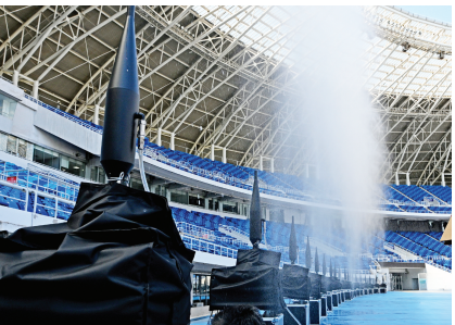
本报讯 (记者 张璐璐)天津奥林匹克中心体育场(“水滴”体育场)近日添置的降温设施——“水炮”正式亮相。