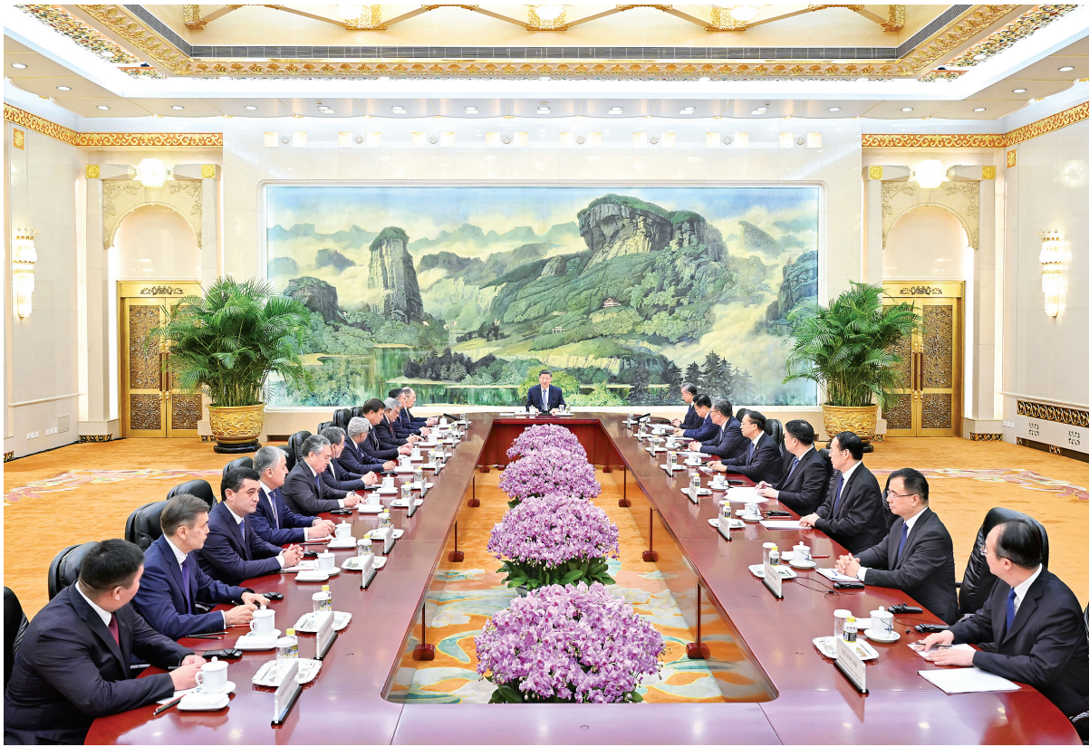
7月15日上午，国家主席习近平在北京人民大会堂集体会见来华出席上海合作组织成员国外长理事会会议的各国外长和常设机构负责人。