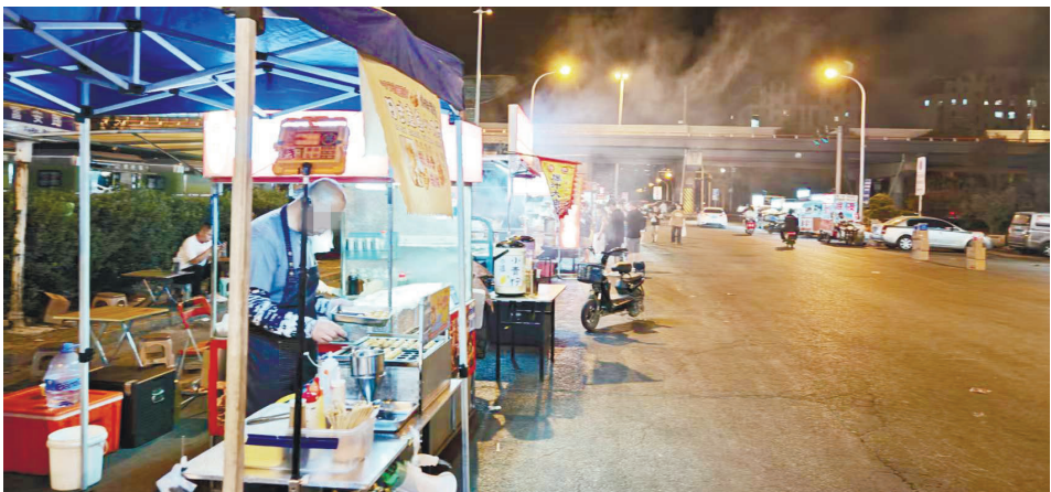
东丽区富安路与津塘公路交口的占路摊贩

那摊贩口中的交费是怎么回事?工作人员介绍,这些违规经营的摊贩在经营过程中,遗留了大量垃圾,导致负责该片区卫生的第三方扫保公司作业负担大幅增加。为平衡清扫成本、达到扫保标准,扫保公司与涉事摊贩协商,按照摊位大小划分经营区域,并依据垃圾产生量收取差异化的保洁费用。