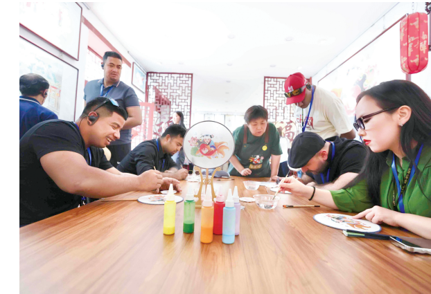
■ 记者 李杨

清晨的阳光热烈地洒在杨柳青古镇的青石板路上,不同语言的谈笑声在雕梁画栋的街巷间回荡。