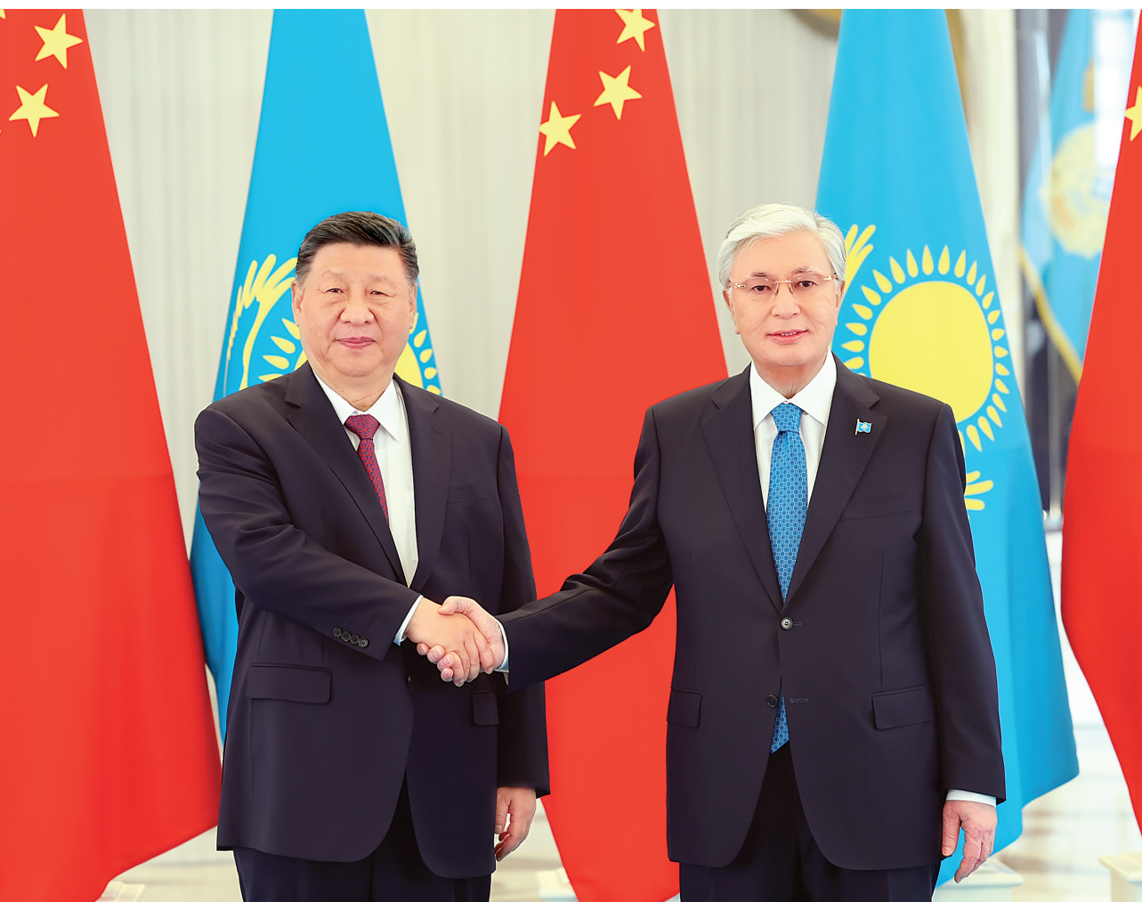
当地时间6月16日下午，哈萨克斯坦总统托卡耶夫同中国国家主席习近平在阿斯塔纳总统府举行会谈。