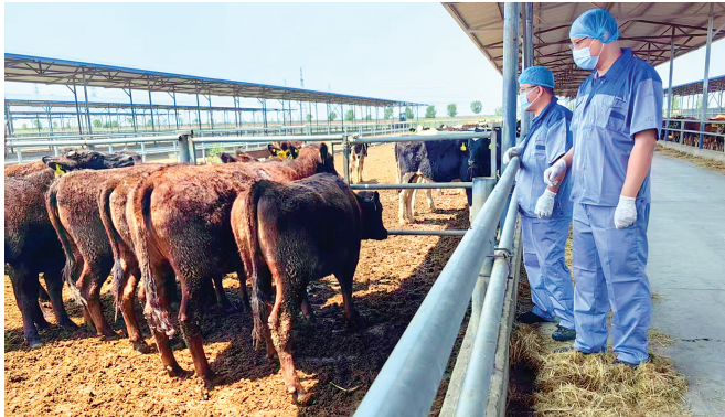
宁河海关驻场人员对种牛进行现场监管。

本报讯(记者 马晓冬)日前,载有3110头澳大利亚种牛的活畜运输船抵达天津港,包含荷斯坦、安格斯、娟姗、澳洲纯血和牛等品种。其中,8头澳洲纯血和牛为天津口岸今年首次进口。在天津海关的监管下,该批种牛将在指定隔离场开展为期45天的隔离检疫。 据悉,纯血和牛是指系谱里未引入其他品种牛基因的和牛,即拥有100%的和牛血统。纯血和牛肉质良好,有着独特的“大理石花纹”,受到许多消费者的喜爱。为助力该批种牛进口,宁河海关利用通道扫描系统辅助进场查验工作,该系统采用了射频识别(RFID)技术,结合种牛佩戴的RFID电子耳标,能够自动读取信息并与对比申报数据,有效缩短了种牛滞留通道的时间。 今年以来,天津海关累计接检进境种牛一万余头,经检疫合格后的种牛被运往吉林、山东、内蒙古等地的牧场,助力我国畜牧业发展。