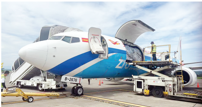
航班在达沃国际机场进行装机。

本报讯(记者 万红)记者从海航航空集团旗下天津货运航空了解到,日前,随着一架搭载着电商货物及日用品的波音737全货机,从南宁起飞前往菲律宾达沃,天津货运航空南宁—达沃国际货运航线正式开通。 南宁—达沃国际货运航线计划每周执飞4班,单程飞行时间4小时左右,将主要运输电商产品、日用品、服装等附加值较高的货物。未来,天津货运航空将进一步优化南宁始发航线网络,探索生鲜冷链运输等全新业务,继续开辟安全高效的空中运输新通道。