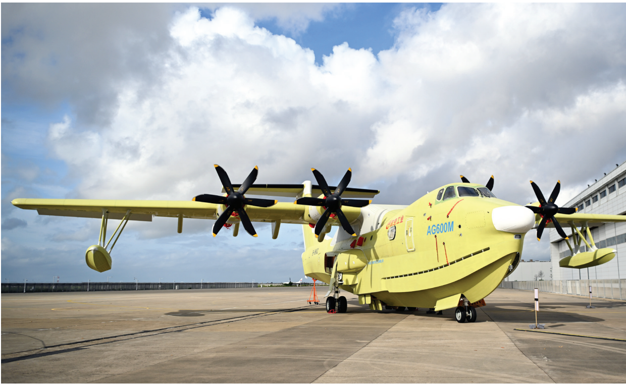
6月11日,在珠海中航通飞华南飞机工业有限公司,现场展示的批量生产的首架AG600飞机。当日,我国完全自主研发的大型水陆两栖飞机AG600“鲲龙”在广东珠海获颁中国民航局生产许可证,标志着AG600飞机正式迈入批量生产阶段。

数据显示,1至5月,我国汽车产销分别完成1282.6万辆和1274.8万辆,同比分别增长12.7%和10.9%,产量增速较前4个月收窄0.2个百分点,销量增速扩大0.1个百分点。