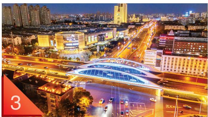
友谊路津谊桥夜景灯光