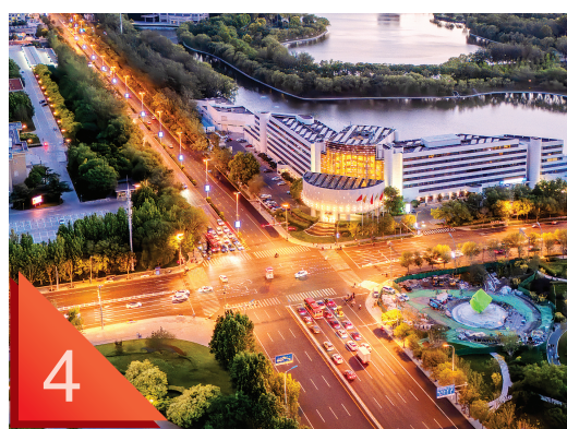
友谊路水晶宫饭店华灯初上