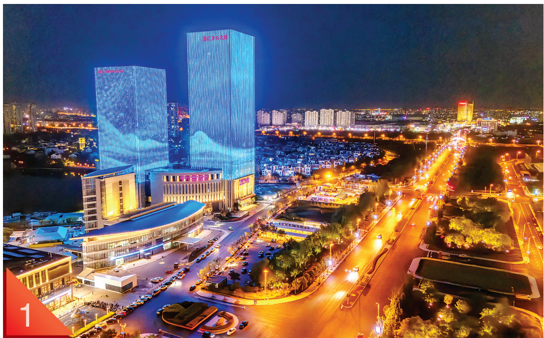
友谊南路梅江中心大厦夜景灯光充满科技感

夜幕降临,我市友谊路沿线灯火璀璨,水晶宫饭店、津谊桥、莲花酒店等地标建筑披上绚丽的光影外衣。