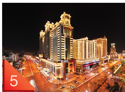
友谊北路罗马花园夜景