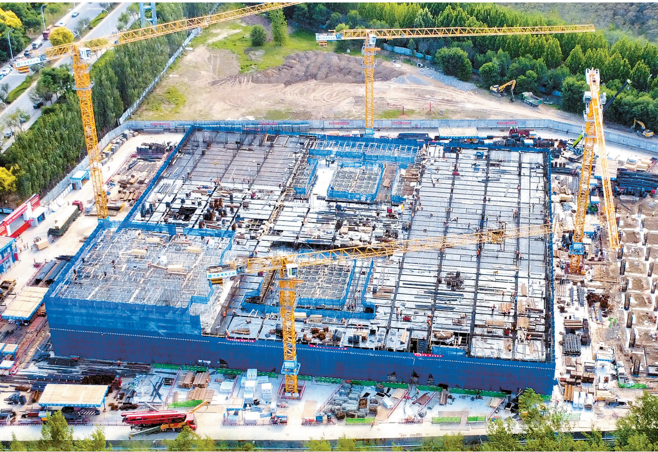
日前,由中建五局承建的中国联通京津冀数字科技产业园项目进入地上主体施工阶段。产业园建成后,将实现万卡AI算力集群(由超过一万张加速卡组成),为京津冀新质生产力发展提供数据支撑。