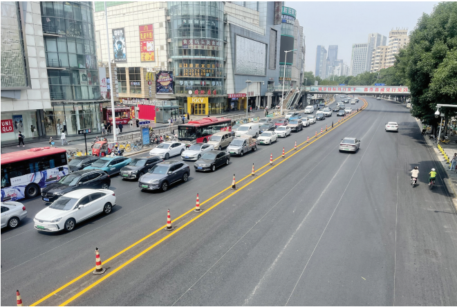
截至5月30日,我市民心工程中的49条重点道路、20座立交桥、12座海河系桥梁的整治维修主体工程全面完工。图为南京路路面焕然一新。